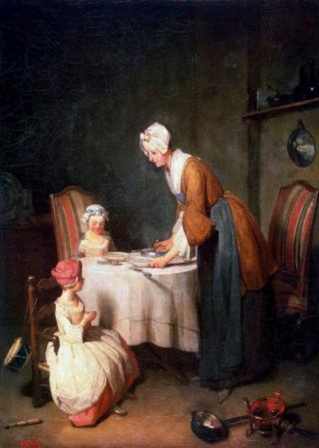
(Жан-Батист Симеон Шарден "Молитва перед обедом")

Французский художник Ж.С. Шарден одним из первых ввел социальные мотивы в свое творчество. Картина "Молитва перед обедом" несет в себе многие черты сентиментализма, в частности, поучительность сюжета. Однако в картине соединяются два стиля - рококо и сентиментализм. Здесь поднимается тема важности женского участия в воспитании у детей возвышенных чувств. Стиль рококо оставил след в построении изящной композиции, множестве мелких деталей, богатстве цветовой палитры. Позы героев, предметы, вся обстановка комнаты изящны, что характерно для живописи того времени. Ясно читается желание художника апеллировать напрямую к чувствам зрителя, что явно указывает на использование при написании полотна сентиментального стиля.