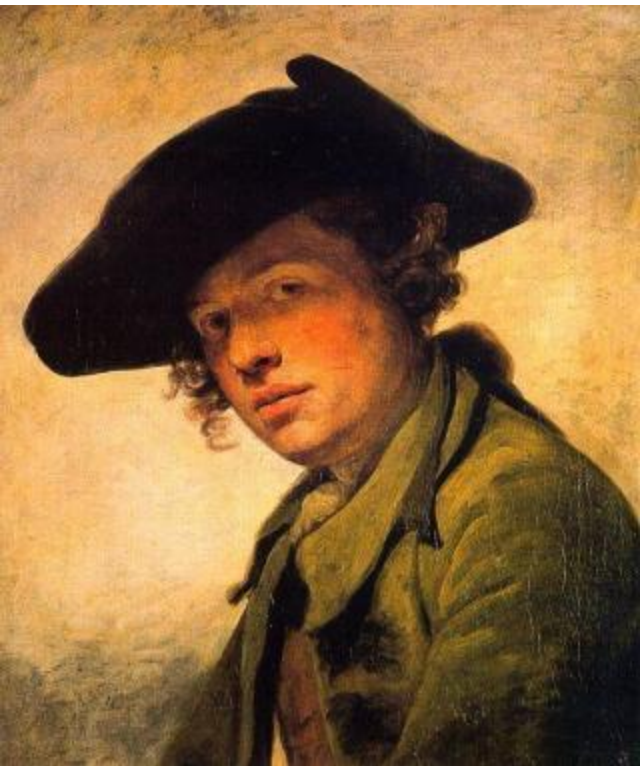
(Жан-Батист Грез "Портрет молодого человека в шляпе")

Одним из ярких представителей направления стал французский художник Ж.-Б. Грёз . Его картины с назидательным сюжетом отличает морализаторство и слащавость. Грёз создал множество картин с тоскующими о мертвых птичках девичьих головках. К своим полотнам художник создавал нравоучительные комментарии, чтобы еще более усилить их нравоучительную идейность.