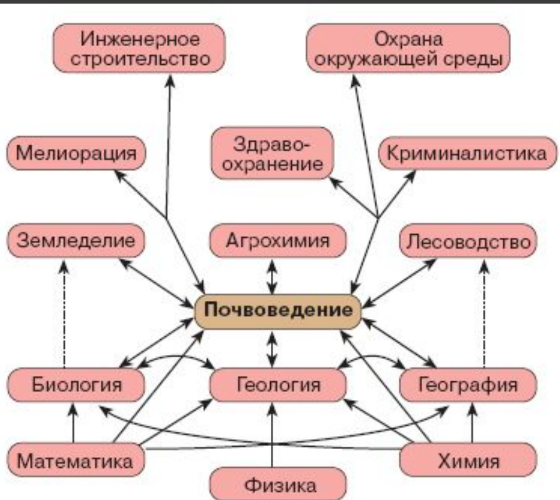
Рис. 2. Место почвоведения в системе наук