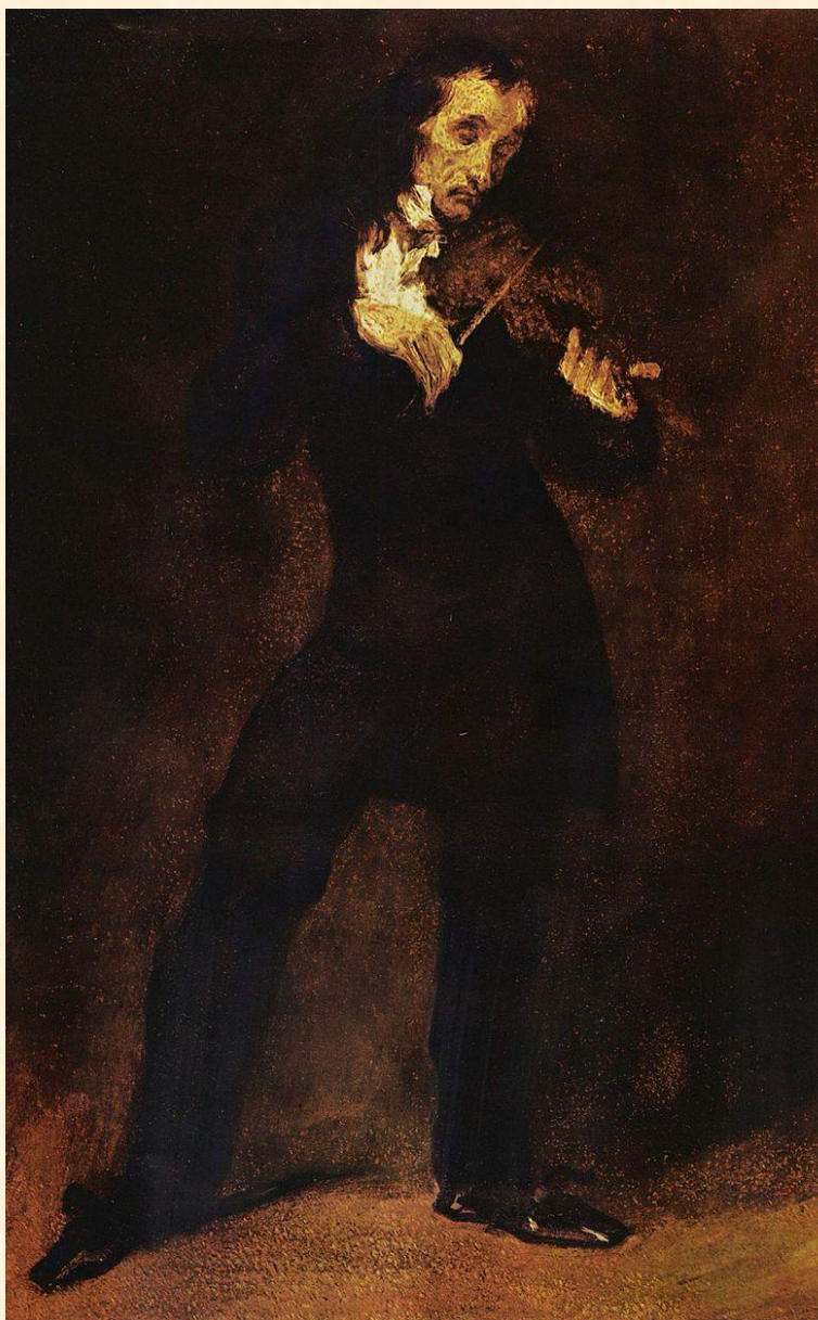
Эжен Делакруа «Портрет Паганини», 1831