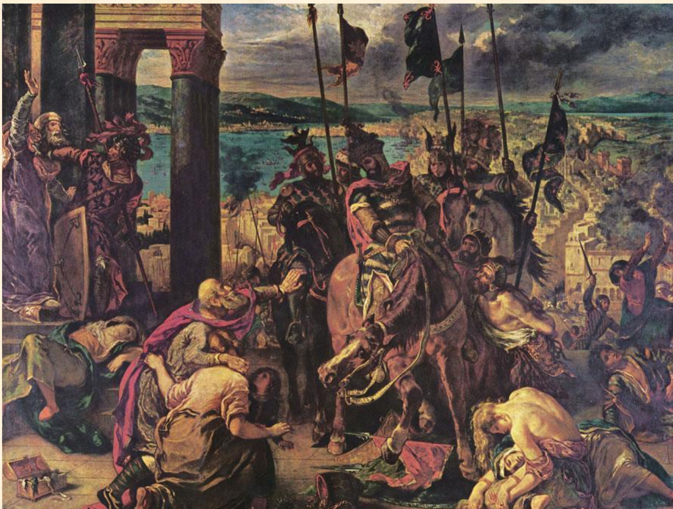
Эжен Делакруа «Взятие Константинополя крестоносцами», 1840