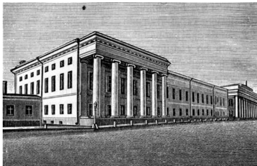
Казанский Императорский университет