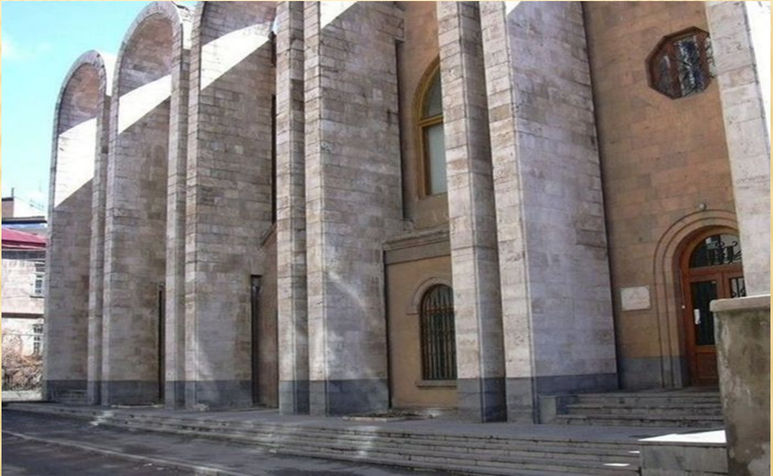
Дом-музей Арама Хачатуряна

И. Хачатурян – композитор XX века, представитель того пласта музыкальной культуры, в котором отражены мысли и чувства нашего современника, жизнь и быт нашей эпохи.