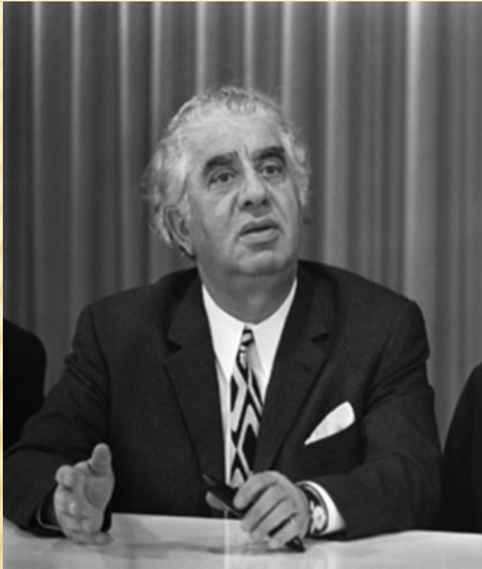
Арам Ильич Хачатурян (1903 – 1978)