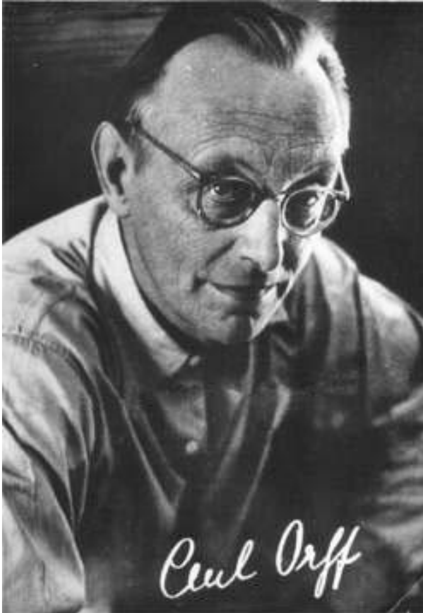
Карл Орф (Карл Генрих Мария) (1895-1982)