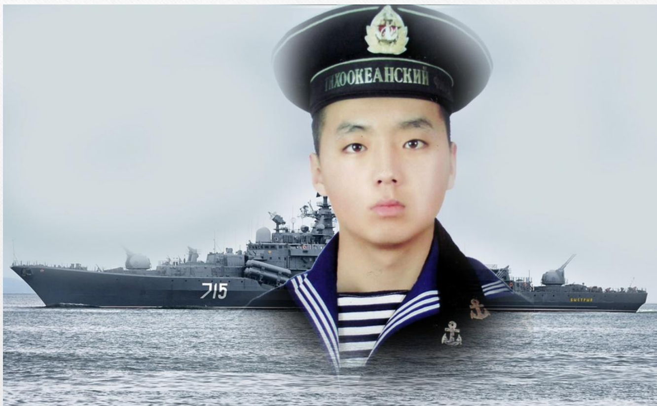
Герой Российской Федерации – Алдар Цыденжапов