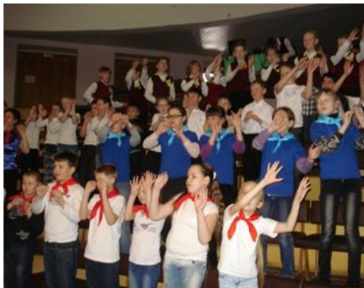
(2– 4 кл. ДОО)