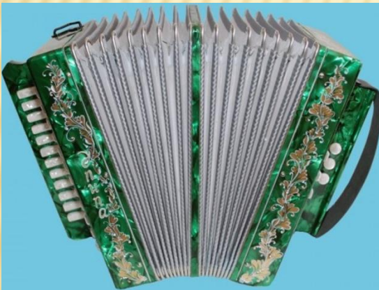
Тальянка – однорядная гармошка