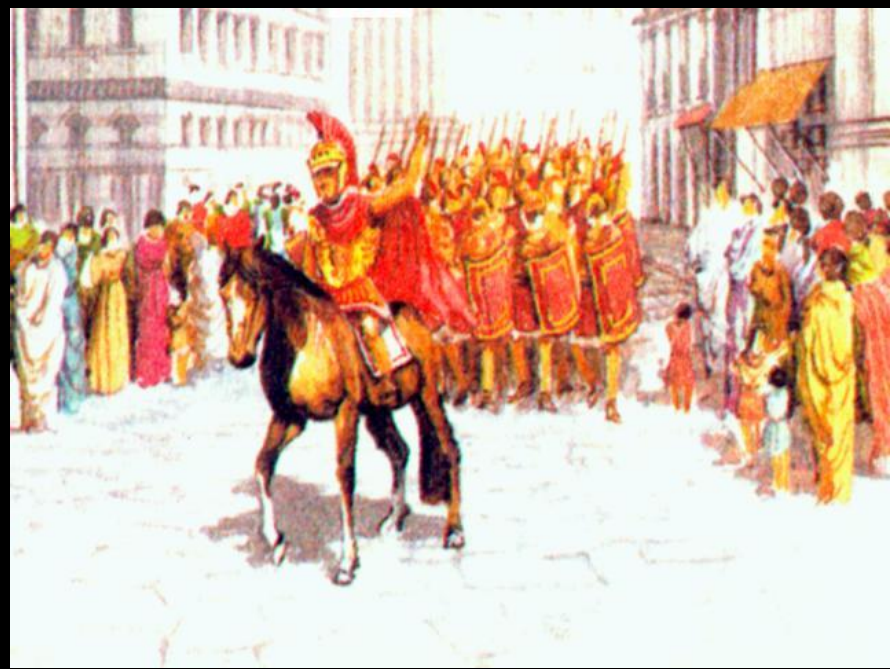
Вступление Цезаря в Рим

На улицах города Цезаря встречала беднота. Помпей и Сенат в страхе бежали на Балканы, где попытались набрать войско для борьбы с Цезарем. Но тот не оставил противникам шансов - он атаковал и разбил войско Помпея. А вскоре сам Помпей погиб.