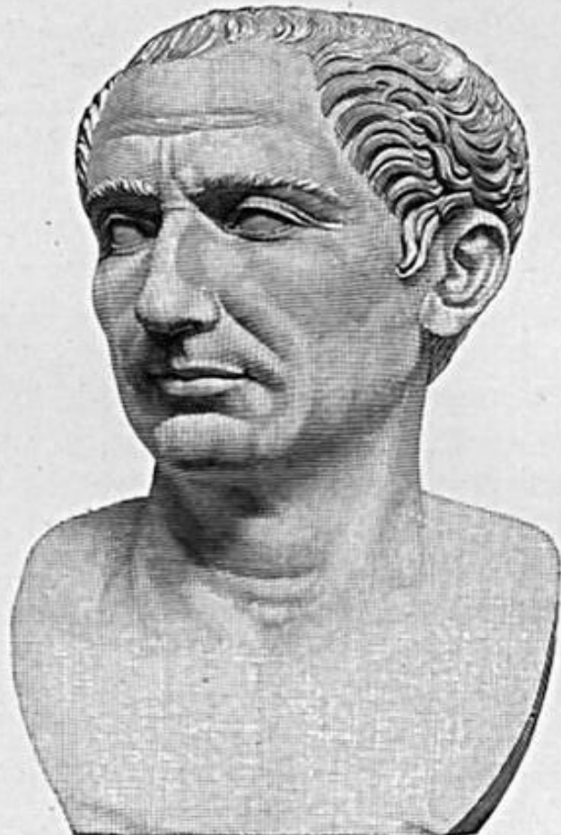
Гай Юлий Цезарь

Гай Юлий Цезарь родился 12 июля 100 г. до н.э. В юности он сосредоточил все свои силы на политической деятельности. В свои 40 лет он стал консулом, одним из самых важных должностных лиц в управлении. Осознавая, что Римская республика уже приближается к своему закату, он сделал все возможное, чтобы ограничить власть сената, создав первый триумвират.