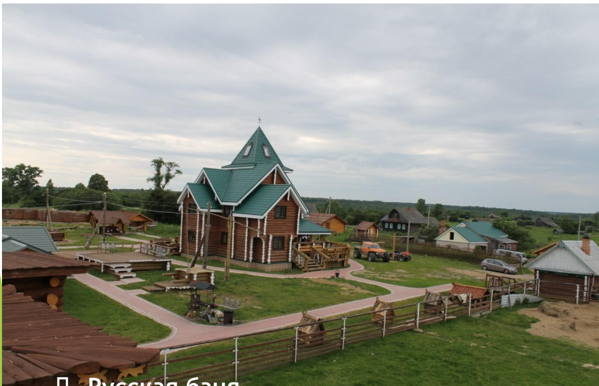
□ Русская баня