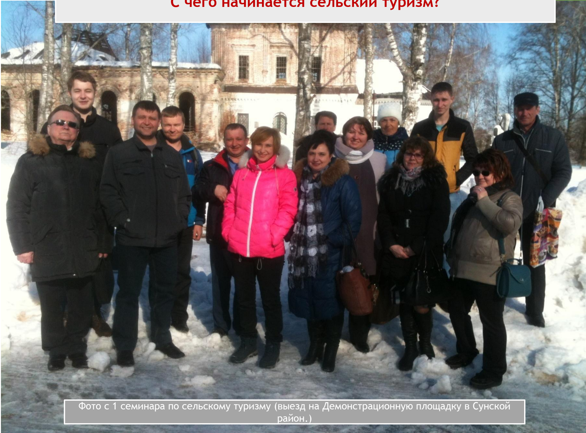
Фото с 1 семинара по сельскому туризму (выезд на Демонстрационную площадку в Сунской район.)