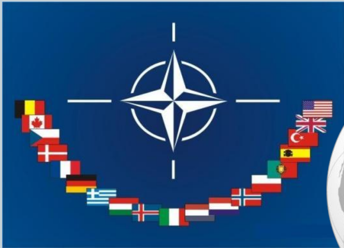
Страны, входящие в блок НАТО