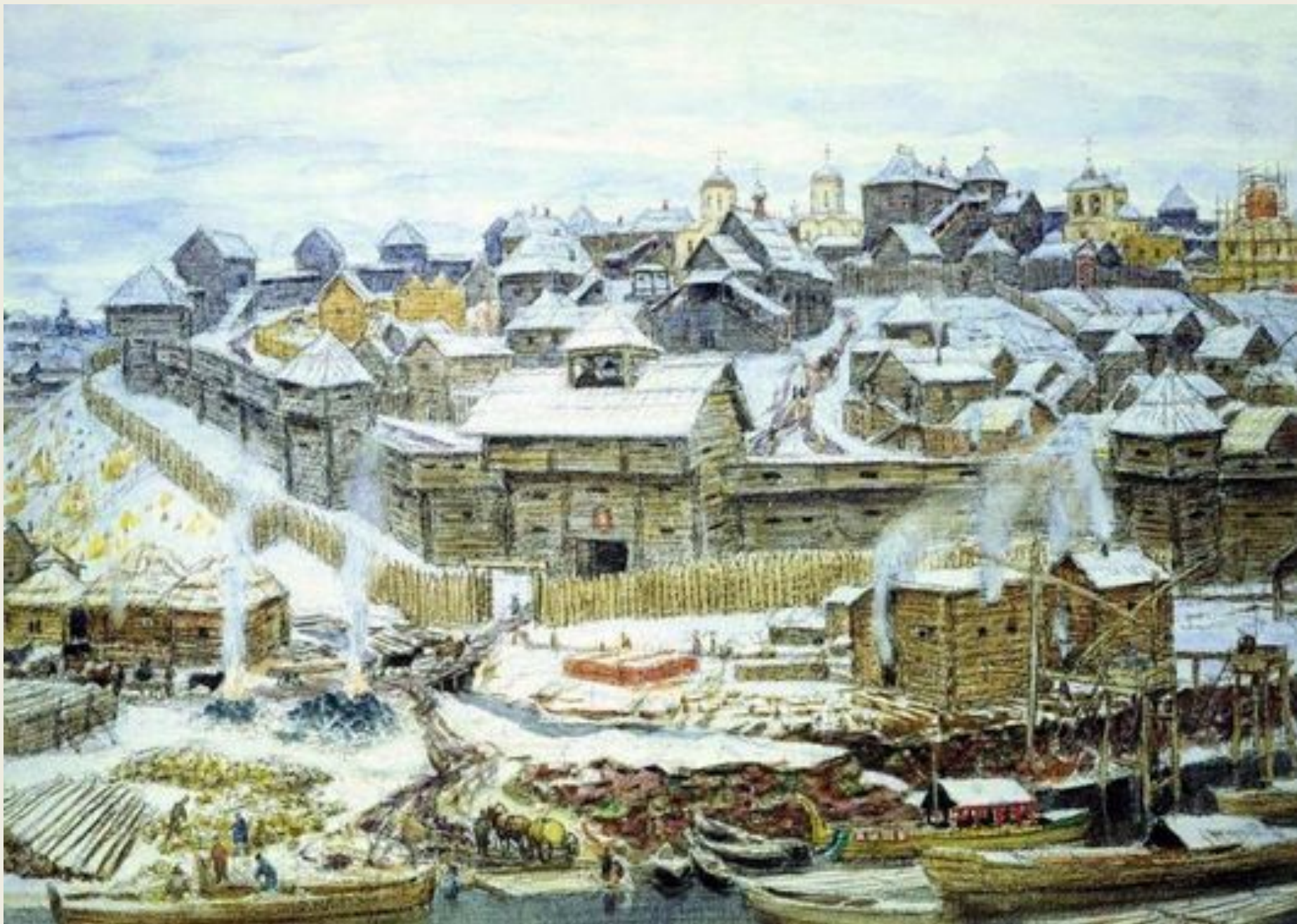
Васнецов А. Московский кремль при Иване Калите