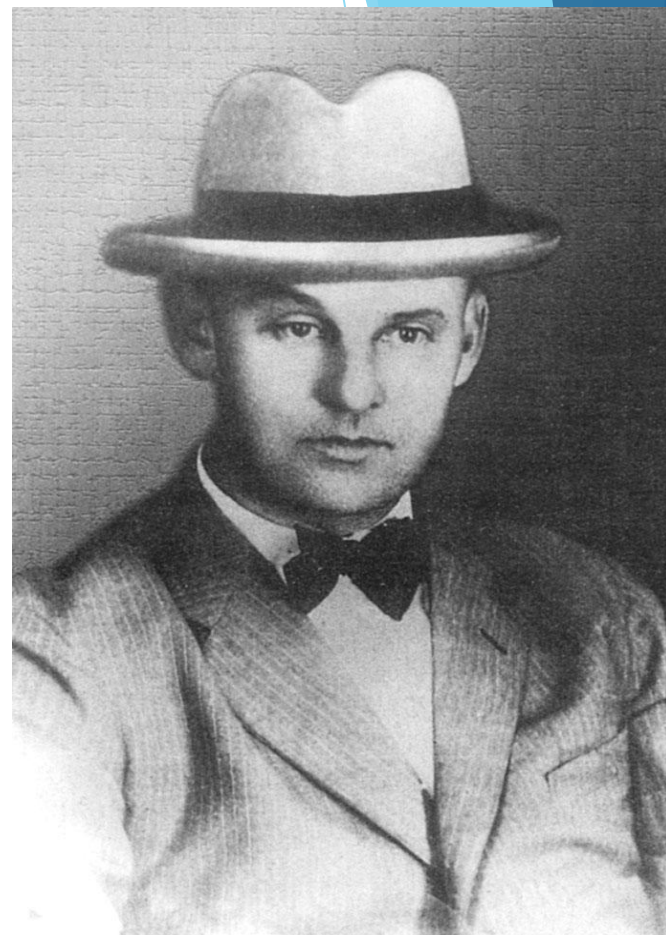
Ощепков В. С.

Фундамент был заложен Василием Сергеевичем Ощепковым (чьим учеником был Харлампиев) и Виктором Афанасьевичем Спиридоновым. Ощепков был великолепным дзюдоистом, учеником Дзигоро Кано, третьим из европейцев, получившим второй дан по дзюдо в Кодокане (лично от Дзигоро Кано).