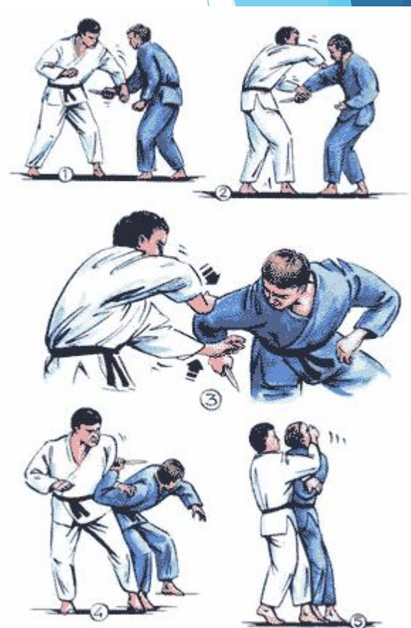
Рис. 76. Боевой прием "Завил руки за спину".