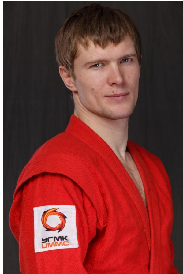
Илья Евгеньевич Хлыбов

Заслуженный мастер спорта России, Чемпион Мира-2007, 2008, 2012, 2013, 2016. Чемпион Европы-2006, 2015, победитель Всемирной Универсиады-2013, Чемпион России-2007, 2008, 2012, 2013, 2014, 2016 гг.