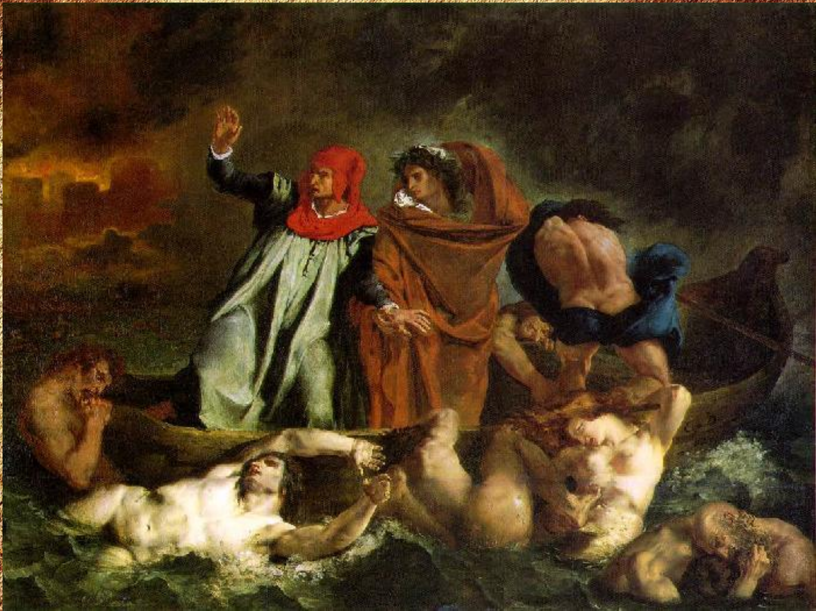
Ладья Данте [1822]