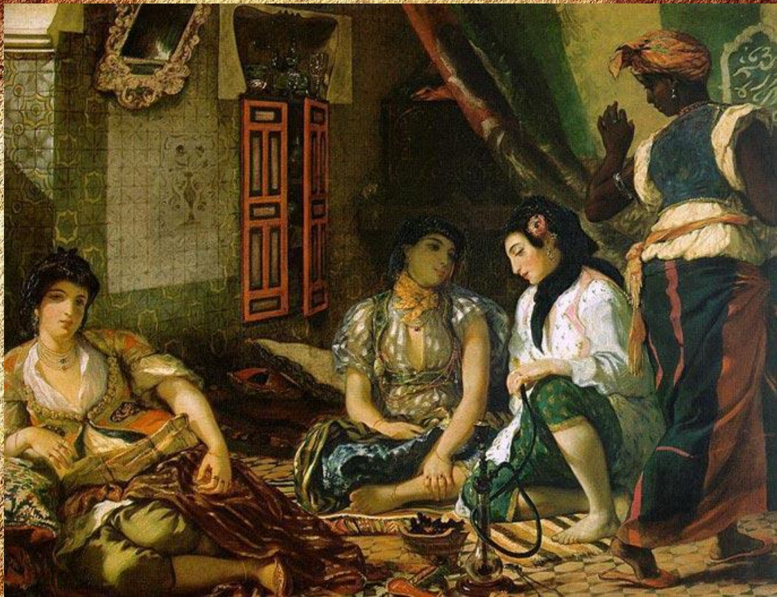
Женщины Алжира в своих покаях 1834, Лувр, Париж