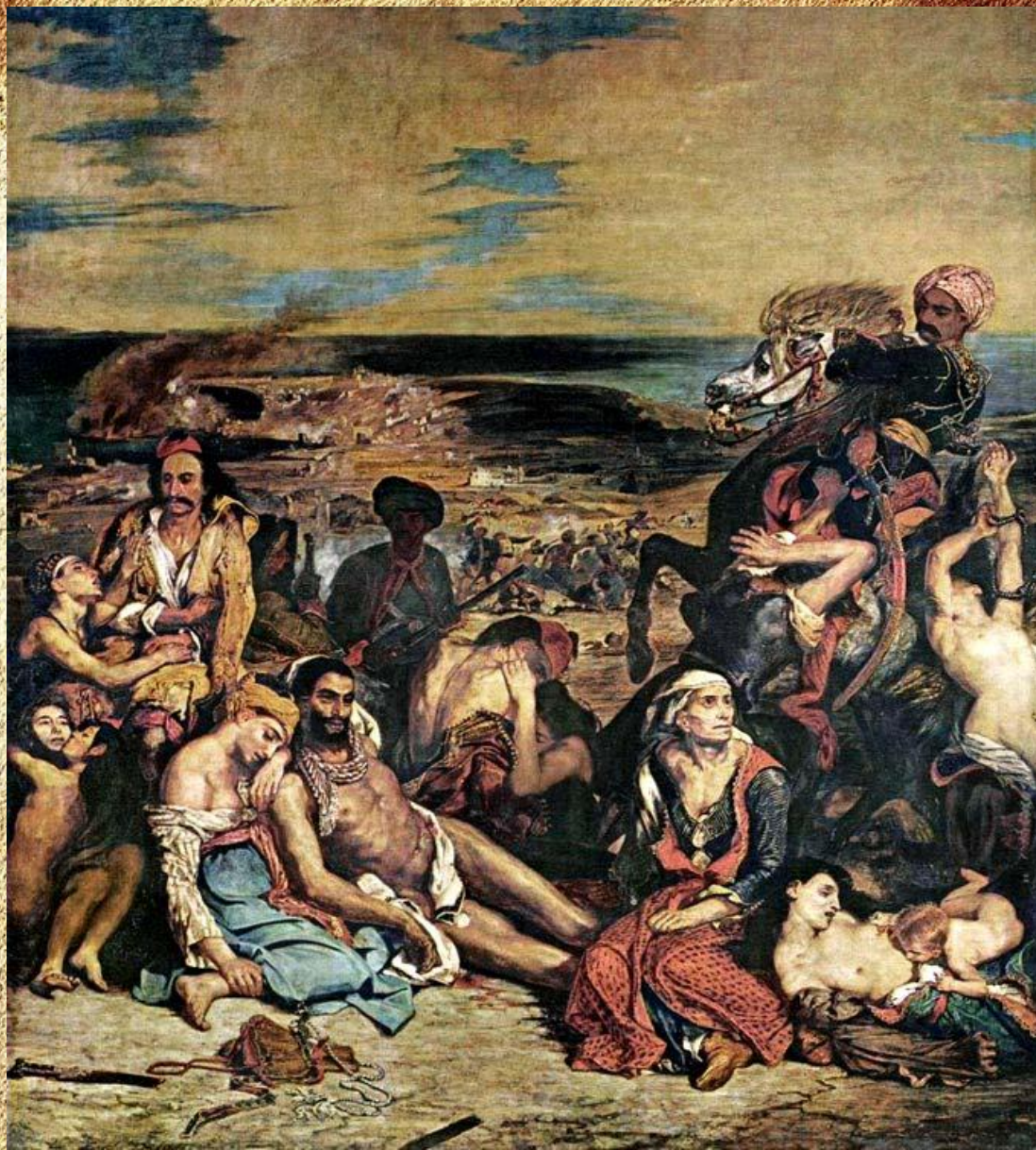
• Резня на Хиосе 1824 г