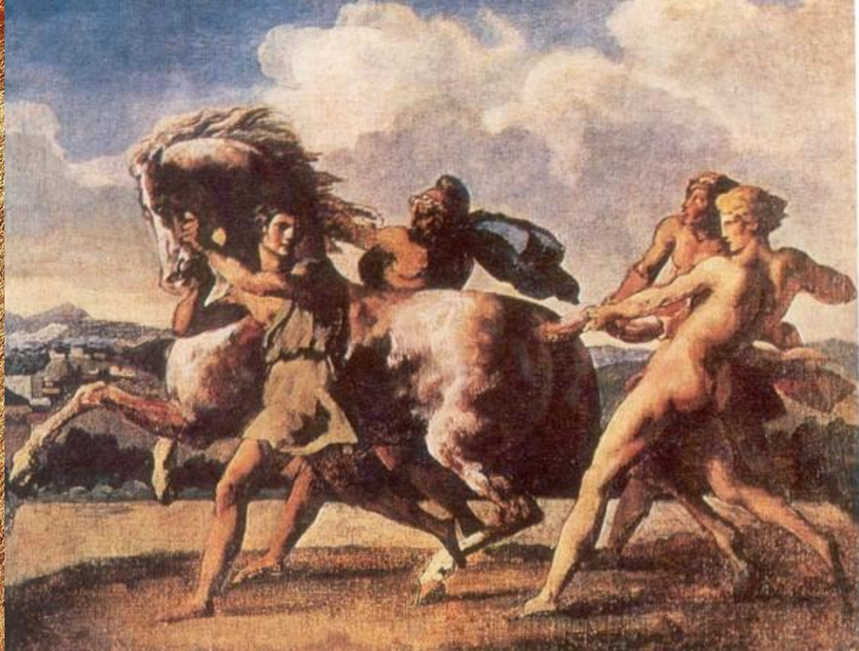
Рабы, останавливающие лошадь (1817)