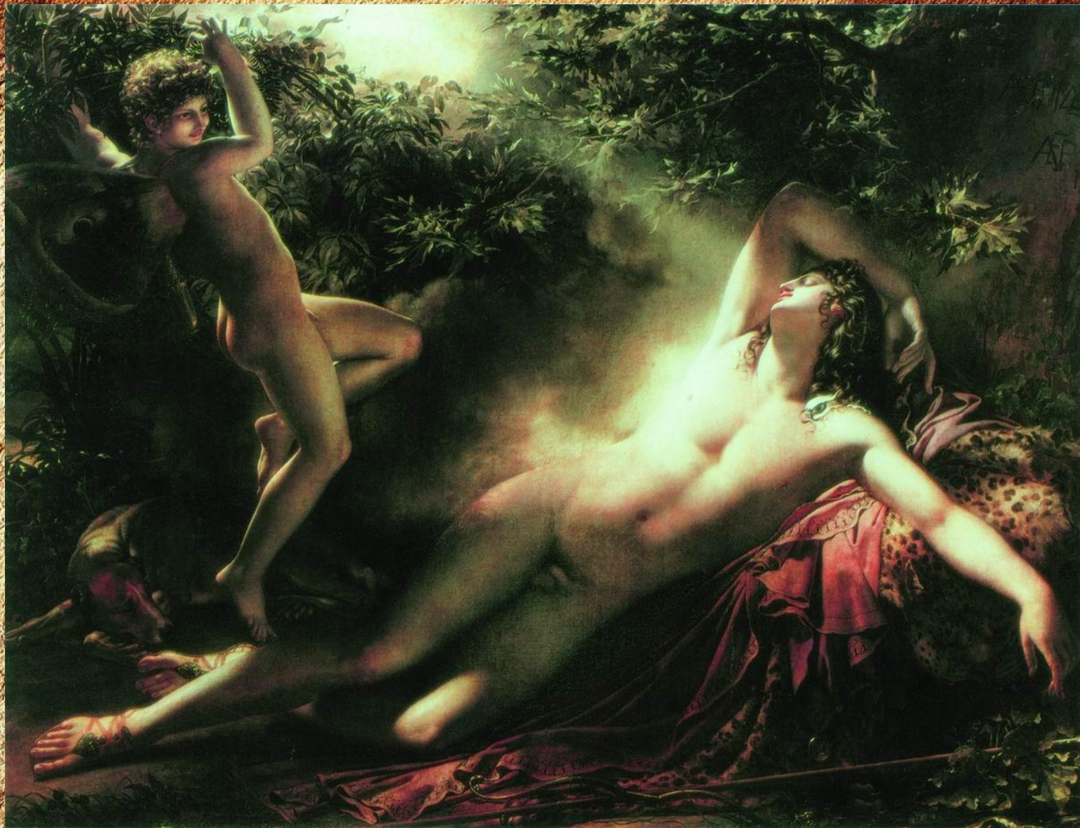
Сон Эндимиона. 1792г Лувр, Париж Материалы: холст, масло Размеры: 198 x 261 см