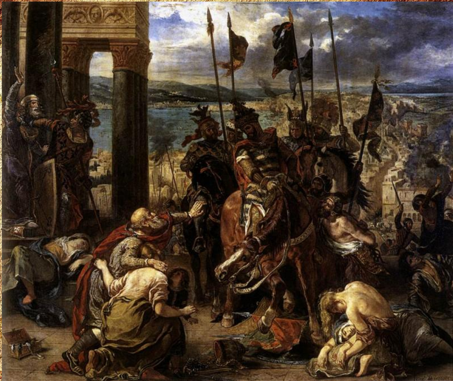
Вступление крестоносцев в Константинополь 1204