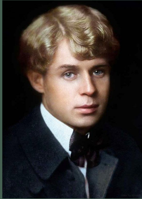
Сергей Александрович Есенин 1895-1925 гг.