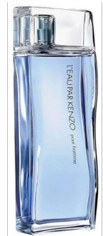
Kenzo L'eau par

В основе аромата невероятная свежесть грейпфрута, бергамота, перца, мягкость лаванды, артемизии, олибанума, ветивера. Аромат для динамичных, сильных и целеустремленных мужчин, которые умеют ценить собственную свободу и независимость.