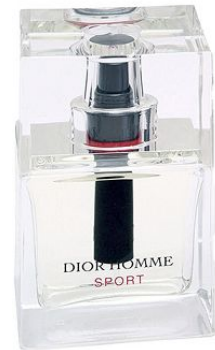
Dior Homme Sport

Аромат с нотами апельсина, альдегидов, перца, нероли, ветивера, ванили, амбры. Свежий и чувственный аромат для прогулок, придаст вам бодрости и силы духа.