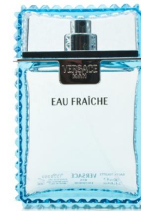
Versace Eau Fraiche