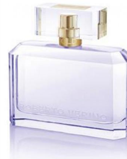
Roberto Verino Gold Diva