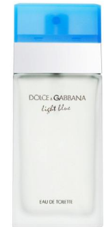
Dolce Gabbana Light Blue

Волнующий, трепетный и ошеломляющий аромат. Свежесть и сияние ему дарит сицилийский лимон, яблоки и колокольчики. Женственность и решительность - жасмин, бамбук и белая роза. Элегантность и насыщенность - кедр, янтарь и мускус. Аромат создан очаровывать, властвовать и покорять.