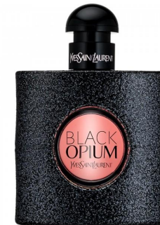
Yves Saint Laurent Black Opium