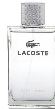
Lacoste Pour Homme