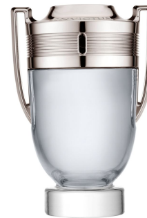
Paco Rabanne Invictus

Семейство: древесные, пряны РРЦ: 100 ml - 750 рублей