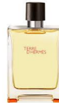
Hermes Terre D'Hermes