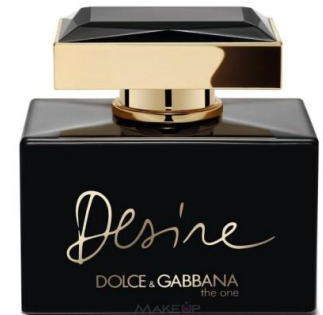
Dolce Gabbana Desire

Палитру смелых и игривых аккордов создает элегантный аромат с нотами апельсина, зеленых нот, листьев и бутонов черной смородины, мискуса, пачули и древесных нот. Неповторимый парфюм, созданный для прекрасных женщин. Невероятно элегантный и стильный, созданный для современных женщин.