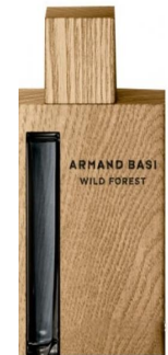
Armand Basi L'eau pour Homme

Элегантный, необычный и запоминающийся аромат, в состав которого входят ноты грейпфрута, апельсина с древесными нотами и дубовым мхом. Аромат сильного, уверенного в себе мужчины. Этот аромат будет вашим секретным оружием.