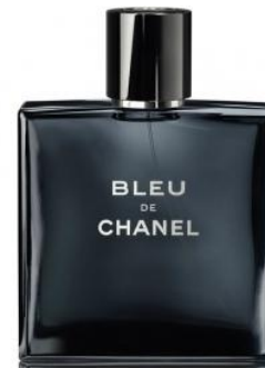
Blue de Chanel