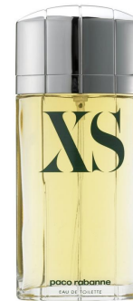
Paco Rabanne XS