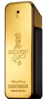
Paco Rabanne 1 Million

Благородный аромат с нотами розы, грейпфрута, пачули, амбры, кожи, мандарина, красного апельсина, белого дерева, специй лимонника. Роскошный и лаконичный аромат создан для эффектного соблазнителя, бесцеремонного и дерзкого.