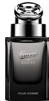
Gucci by Gucci