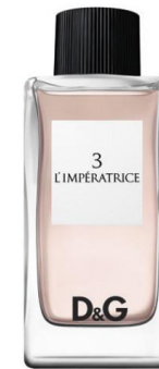
Dolce Gabbana L'Imperatrice