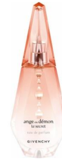
Givenchy Ange ou Demon Le Secret