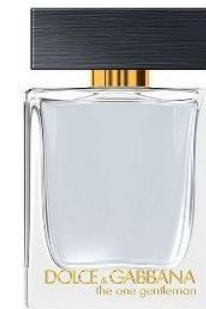
Dolce Gabbana The one gentleman