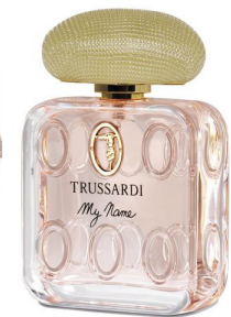
Trussardi My Name

Классический, изысканный аромат с нотами красной фрезии, ямайского перца, масло мускатного ореха, амбры, болгарской розы, сандалового дерева, замши, гималайского кедра. Этот аромат наполнен возбуждающей мягкостью, удивительной чувственностью и притягательным очарованием. Пробуждает искреннюю женскую непосредственность и приводит окружающих мужчин в полный восторг.