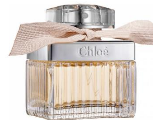
Chloé de parfum