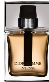
Dior Homme Intense

Семейство: пряные, древесные РРЦ: 100 ml - 750 рублей