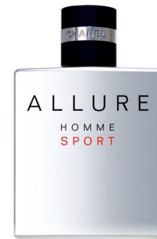
Chanel Allure Homme Sport