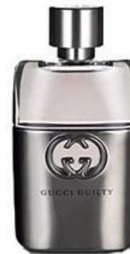
Gucci Guilty Pour Homme