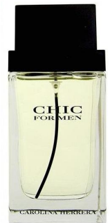
Carolina Herrera Chic

Аромат с нотами розмарина, нероли, лаванды, жасмина, мускатного шалфея, герани, гальбанума, дубового мха, ветивера. Отлично сочетается с костюмом, и Вы почувствуете себя настоящим Джентельменом.