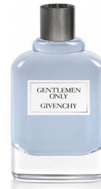
Givenchy Gentlemen Only