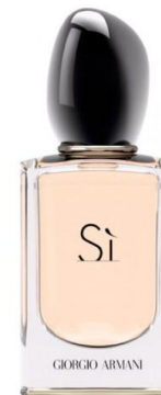
Giorgio Armani Si

Год выпуска: 2015г. Пирамида композиции: Начальные ноты: лист черной смородины Ноты сердца: белая фрезия, майская роза, ваниль, амбрас Ноты шлейфа: пачули, древесные ноты Семейство: шипровые, фруктовые РРЦ: 50 ml - 650 рублей