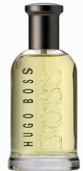
Hugo Boss Boss

Аромат с нотами лимона, сливы, яблока, гвоздики, корицы, красного дерева и сандала. Этот аромат становится неотъемлемой частью стиля делового уверенного в себе мужчины, ценящего свое время и деньги.