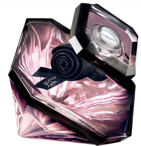
Lancome La nuit Tresor

Аромат противопоставляет внутри себя необычные и редкие ингредиенты. Одновременно свежий и легкий, капризный и насыщенный. Образ современной непримиримой женщины подчеркнут сладкие ноты, чарующие ноты жасмина и ириса придают яркость и женственность. Миндаль и кофе - яркость и энергичность. Ноты бобов тонка, сандала и ванили, подчеркнут притягательный аромат.