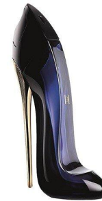
Carolina Herrera Good Girl

Год выпуска: 2017г. Пирамида композиции: Начальные ноты: миндаль и кофе Ноты сердца: жасмин, самбак, тубероза, ирис Ноты шлейфа: бобы тонка, какао, сандал, ваниль Семейство: восточные, цветочные РРЦ: 50 ml - 650 рублей