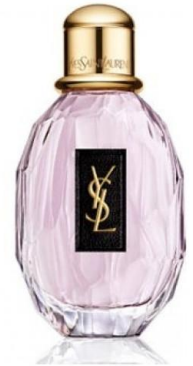
Yves Saint Laurent Parisienne

Притягательный аромат с нотами грейпфрута, мандарина, черной смородины, красного апельсина, розы, ландыша и ванили. Роскошный, мягкий и богатый аромат характеризует элегантность, чувственность и женственность. Аромат навеивает романтические мысли и окутывает легкой цветочной дымкой.