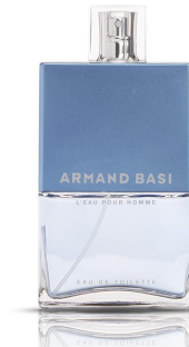
Armand Basi L'eau pour homme

Семейство: древесные, водянь РРЦ: 100 ml - 750 рублей