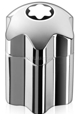
Mont Blanc Emblem Intense

Аромат для уверенных мужчин с нотами ветивера, амбры, мяты, мирты и кедра. Аромат для истинных соблазнительей, покорителей и завоевателей. Чувственный и сексуальный аромат для ярких мужчин.