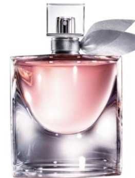
Lancome La vie est belle