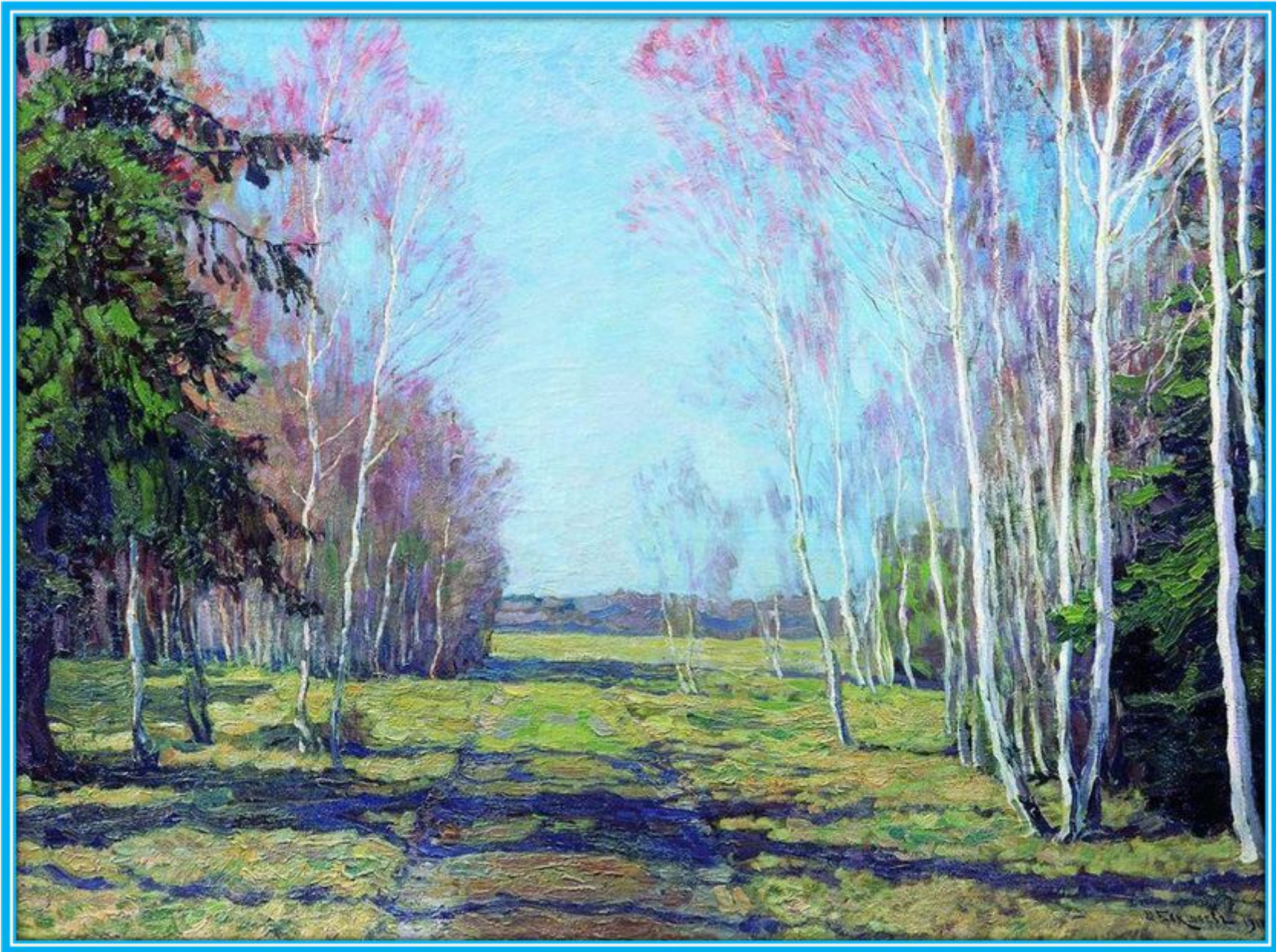
Бакшеев Василий Николаевич (1862-1958). В начале весны. 1917