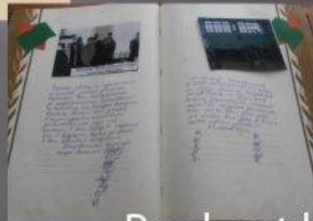
Еске алу кітабы