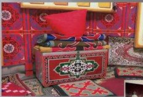
көлөнер және алтын мен асыл тастар мұражайы