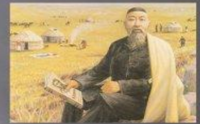
Ә.Қастеев атындағы мұражайының көрмелері