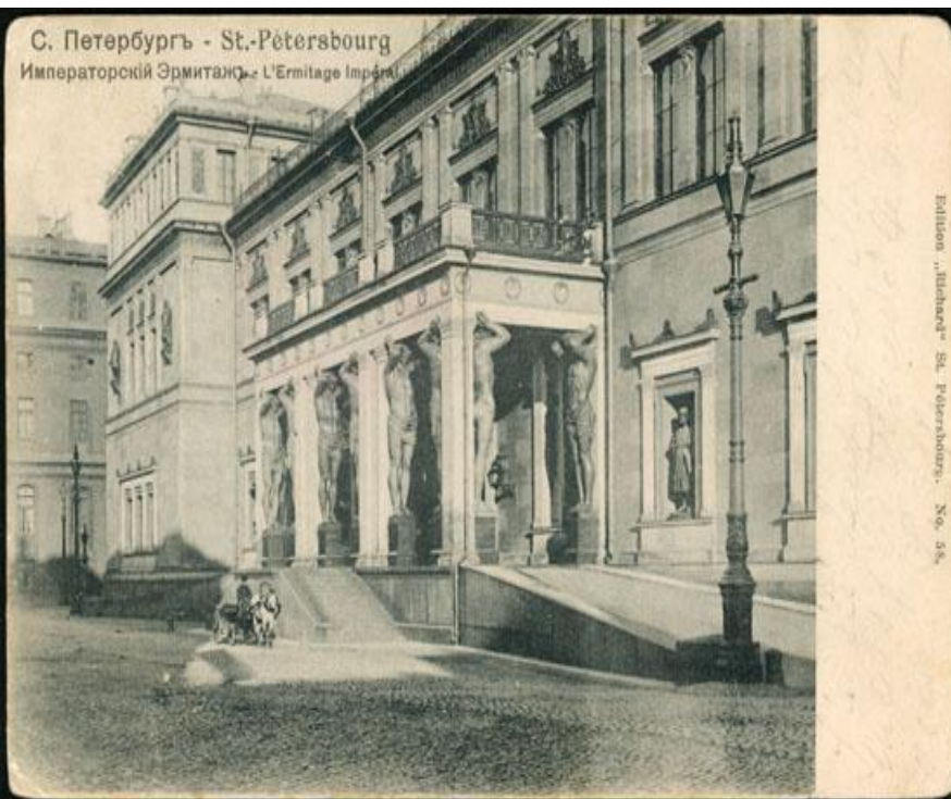
Enlèvement „Michaël“ St. Petersburg. - No. 38.