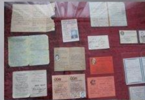
Господарь Анатаолий Юрьевичтің құжаттары мен мадақтау қағаздары