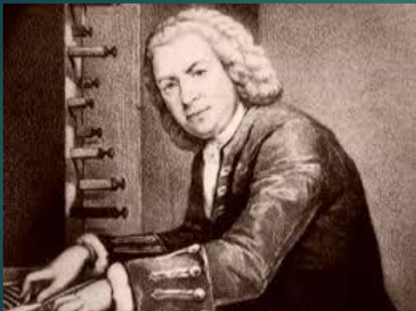
Иоганн Себастьян Бах