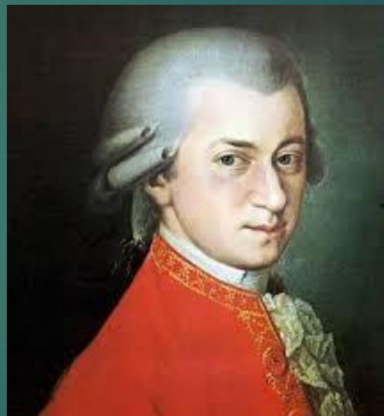
Вольфганг Амадей Моцарт