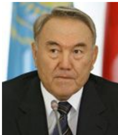
Қазақстан Республикасының Президенті Нұрсұлтан Әбішұлы Назарбаев