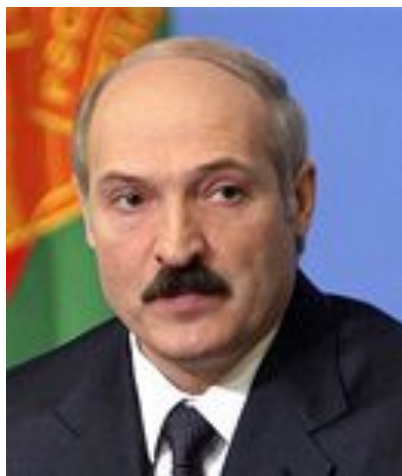
Беларусь Республикасының Президенті Александр Григорьевич Лукашенко