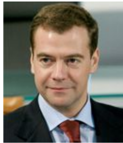
Ресей Федерациясының Президенті Дмитрий Анатольевич Медведев