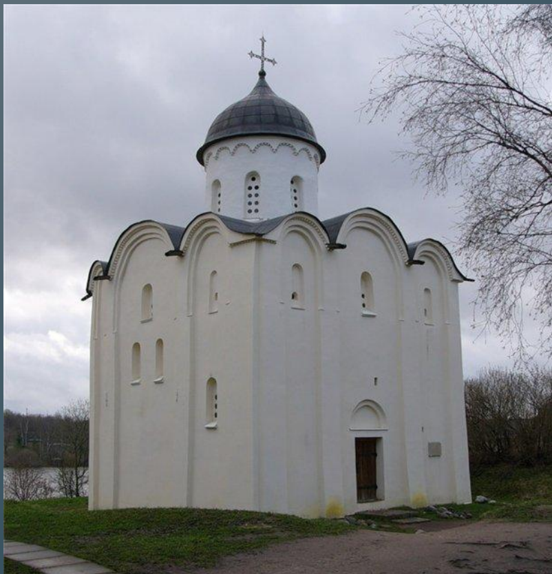
Церковь св. Георгия на Ладоге