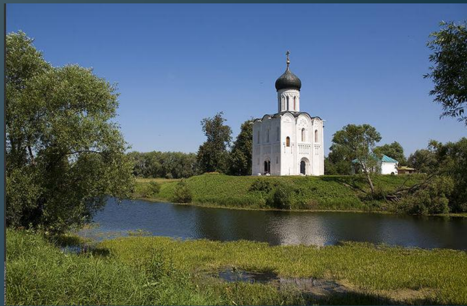
Храм Покрова на Нерли