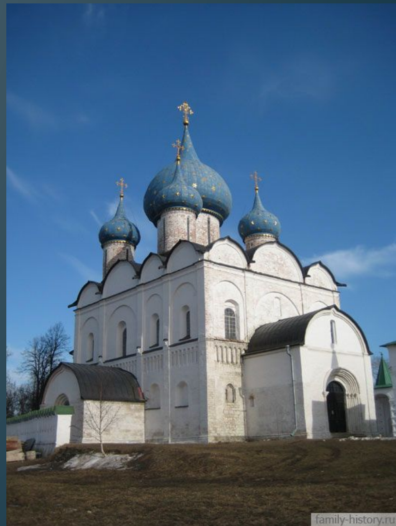
Собор Рождества Богородицы в Суздале, 1122-1125