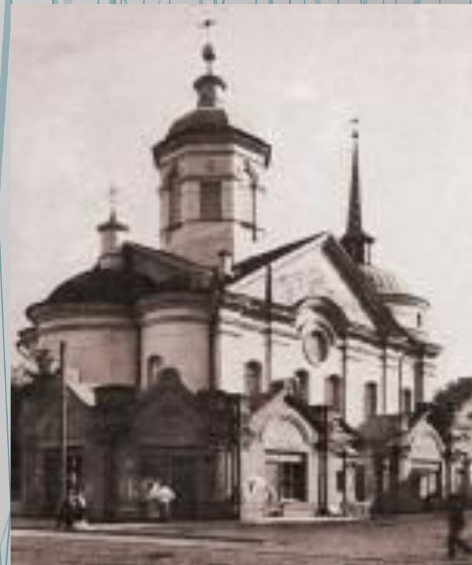
Церковь Успения Богородицы Пироговци (1131-1136)

Кирилловская церковь в Киеве была построена в середине XII. Стены Кирилловской церкви покрыты живописью — фресками XII века