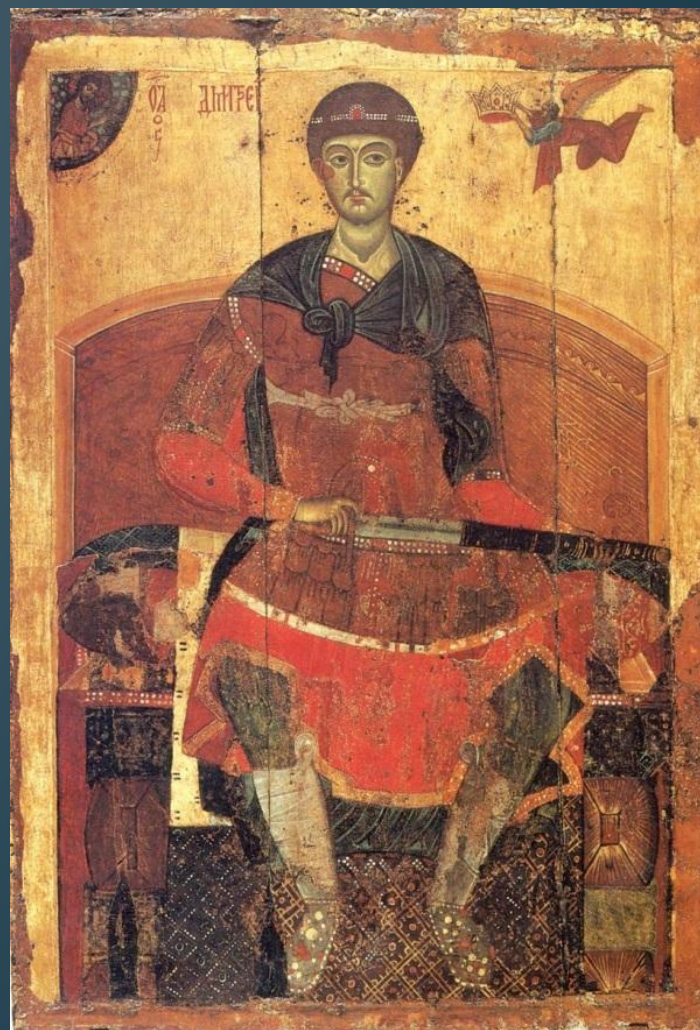
Дмитрий Солунский XII в.