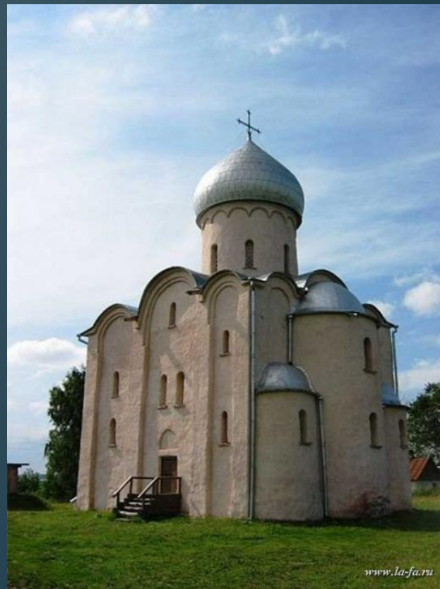
Церковь Спаса на Нередице под Новгородом