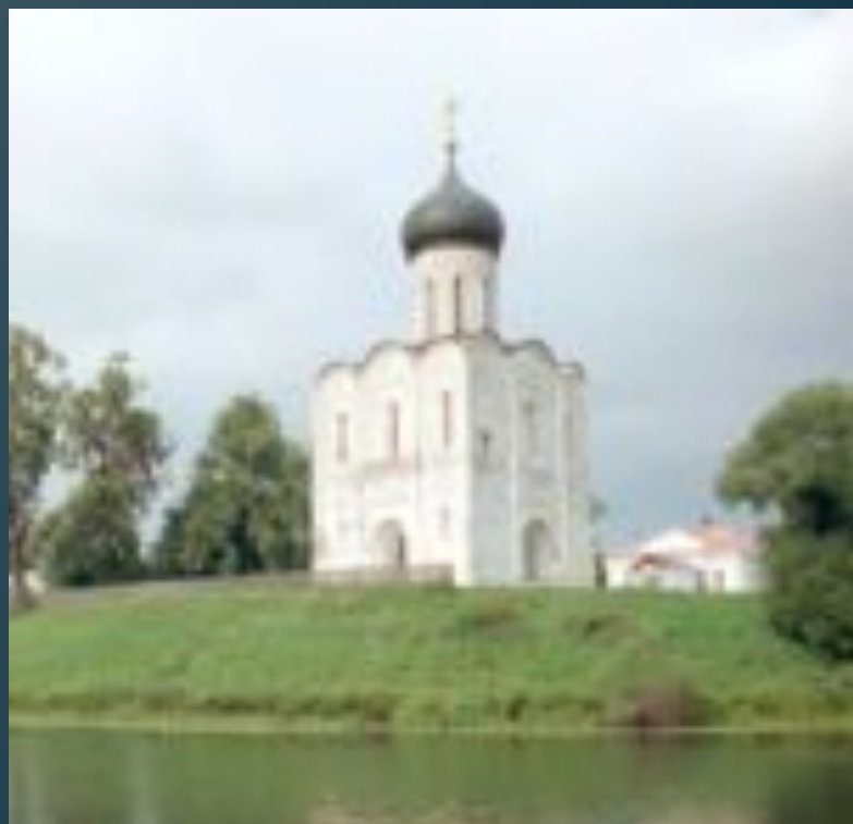
Церковь Покрова́ на Нерли́