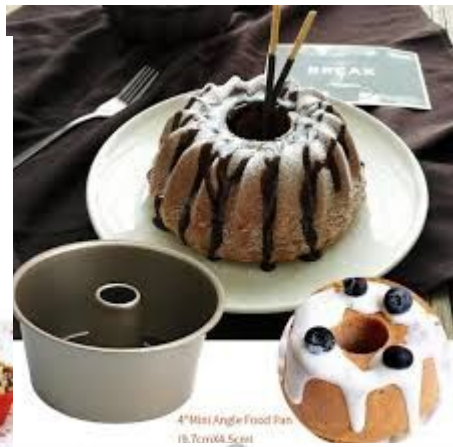
4" Mini Angle Food Pan 18,7cmx6,5cm