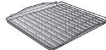
Глубокая форма для запекания с крышкой