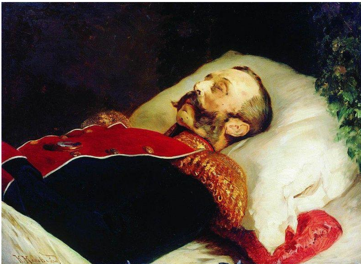
К. Е. Маковский Портрет Александра II на смертном одре (1881).