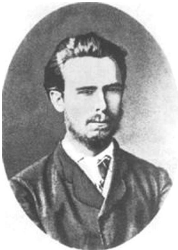
Нечаев С. Г. (1847 – 1882)