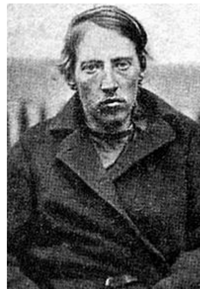
Д. В. Каракозов