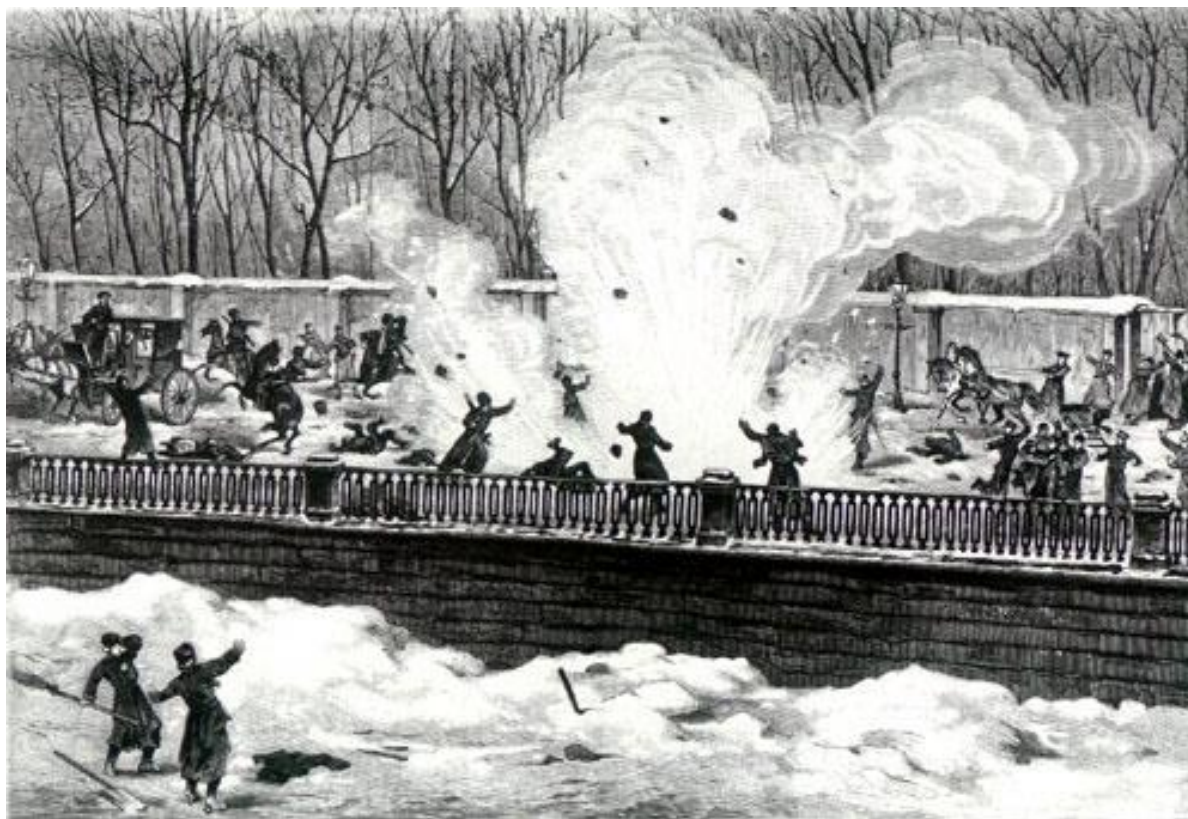
Покушение на Александра II 1 марта 1881 года