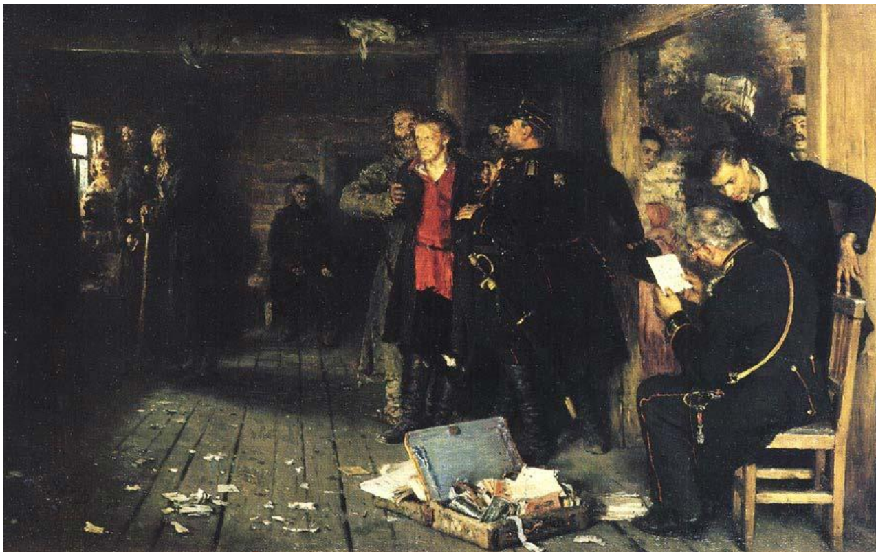
Репин Илья Ефимович. Арест пропагандиста. 1880-1889. Государственная Третьяковская галерея