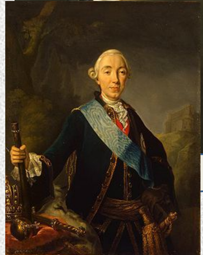
Коронационный портрет императора Петра III Фёдоровича