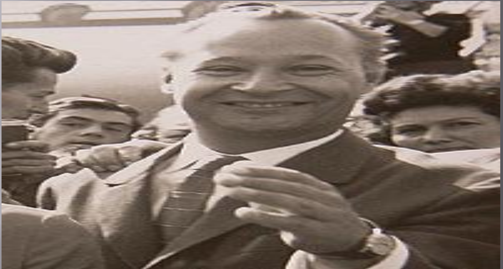
Александр Дубчек - первый секретарь Коммунистической партии Чехословакии (КПЧ) январь-август 1968