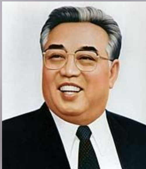
Ким Ир Сен

Лидер КНДР Ким Ир Сен был уверен, что правительство Юга с помощью США ведет подготовку к захвату всей Кореи. Ему удалось заручиться поддержкой СССР и Китая. 25 июня 1950г. Корейская народная армия выступила на юг страны.