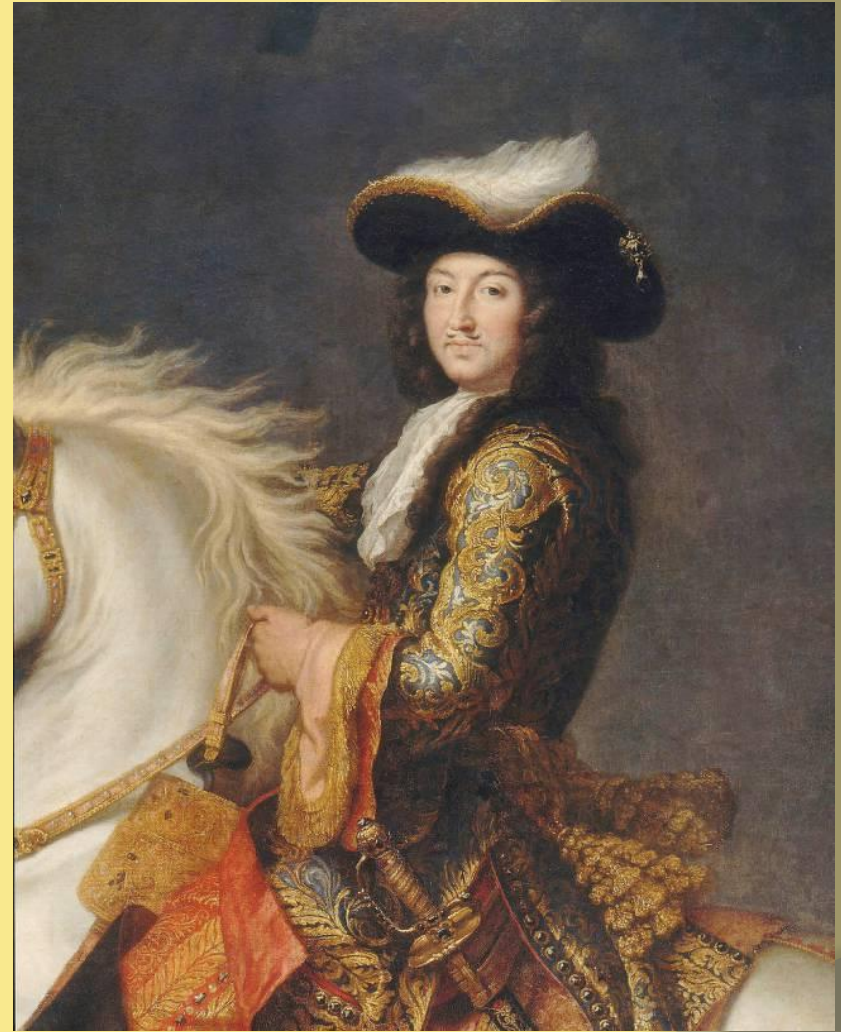
Людо́вик XIV де Бурбо́н

получивший при рождении имя Луи-Дьёдонне («Богоданный», фр. Louis-Dieudonné ), также известный как «король-солнце» [5] ( фр. Louis XIV Le Roi Soleil ), также Людовик Великий ( фр. Louis le Grand ), ( 5 сентября 1638 , Сен-Жермен-ан-Ле — 1 сентября 1715 , Версаль ) — король Франции и Наварры с 14 мая 1643 г. Царствовал 72 года — дольше, чем какой-либо другой европейский король в истории (из монархов Европы дольше у власти были только некоторые правители мелких государств Священной Римской империи , например, Бернард VII Липпский или Карл Фридрих Баденский )