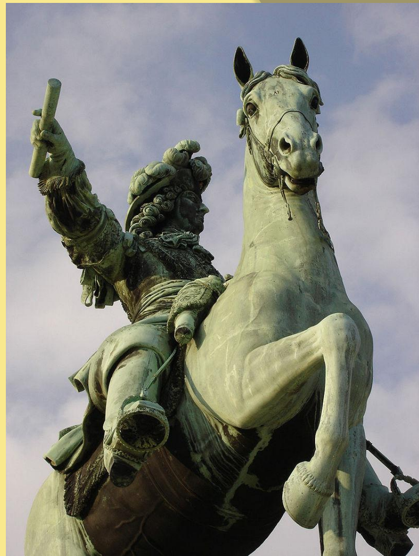
Статуя Людовика XIV в Версале