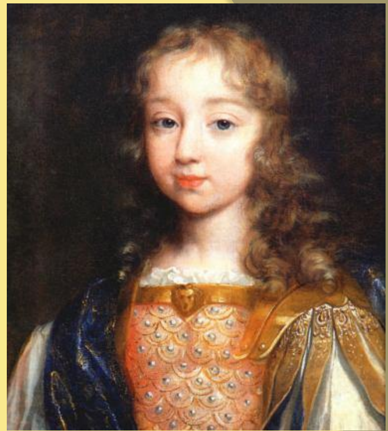
Детский портрет будущего короля Людовика

сторонником принципа абсолютной монархии и божественного права королей (ему приписывают выражение «Государство — это я!»), укрепление своей власти он сочетал с удачным подбором государственных деятелей на ключевые политические посты. Царствование Людовика — время значительной консолидации единства Франции, её военной мощи, политического веса и интеллектуального престижа, расцвета культуры, вошло в историю как Великий век . Вместе с тем долголетние военные конфликты, в которых Франция участвовала во время правления Людовика Великого, привели к повышению налогов, что тяжёлым бременем легло на плечи населения и вызвало народные восстания, а в результате принятия эдикта Фонтенбло , отменившего Нантский эдикт о веротерпимости внутри королевства,