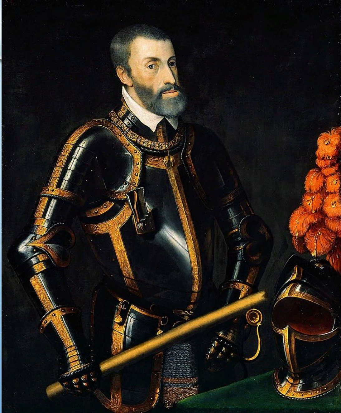
Карл V Габсбург