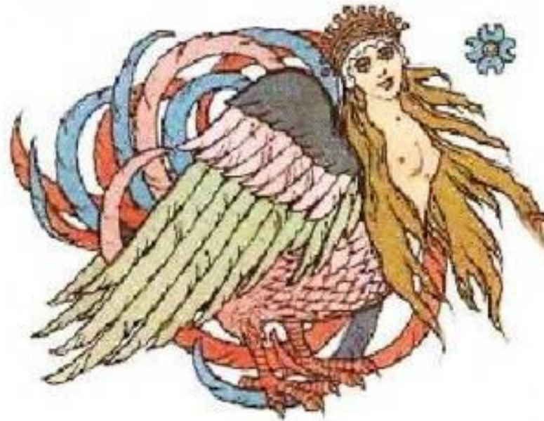
Иван Билибин «Алконост»

По сказанию 17 века Алконост пребывает близ рая и когда поет, то сама себя не ощущает. Алконост утешает своим пением святых, возвещая им будущую жизнь. Алконост несёт яйца на берегу моря и, погружая их в глубину моря, делает его спокойным на 7 дней. Пение Алконоста настолько прекрасно, что услышавший его забывает обо всём на свете.