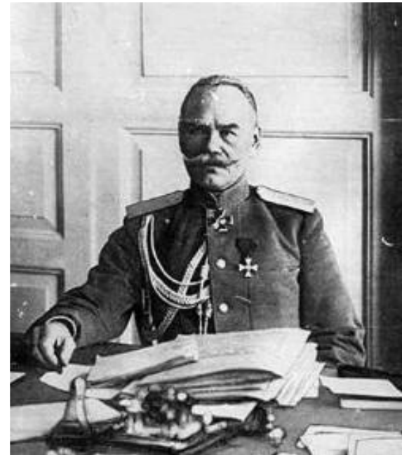
Верховный руководитель Добровольческой армии А.В.Алексеев

Дальний Восток: высадка американских и японских войск.