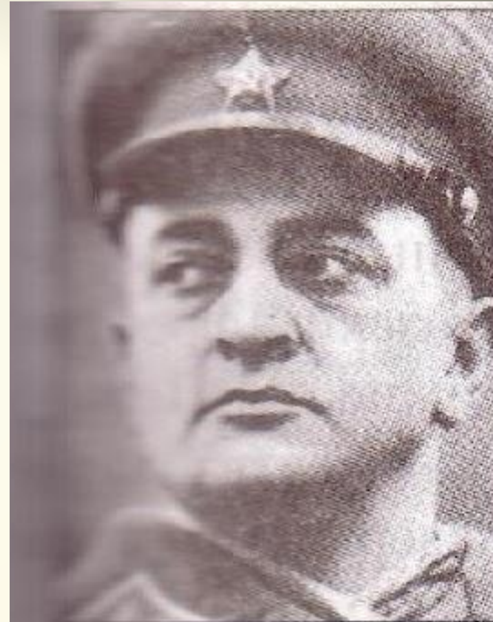
М. Н. Тухачевский