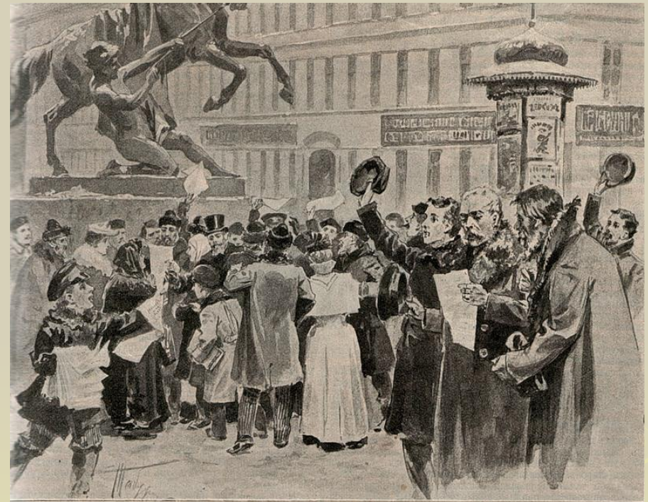
«Вестник» манифеста 28-го января в Петербурге, у Анничкова моста. Ориг. рис. (собств. «Нивы») В. А. Табурина, авт. «Нивы».