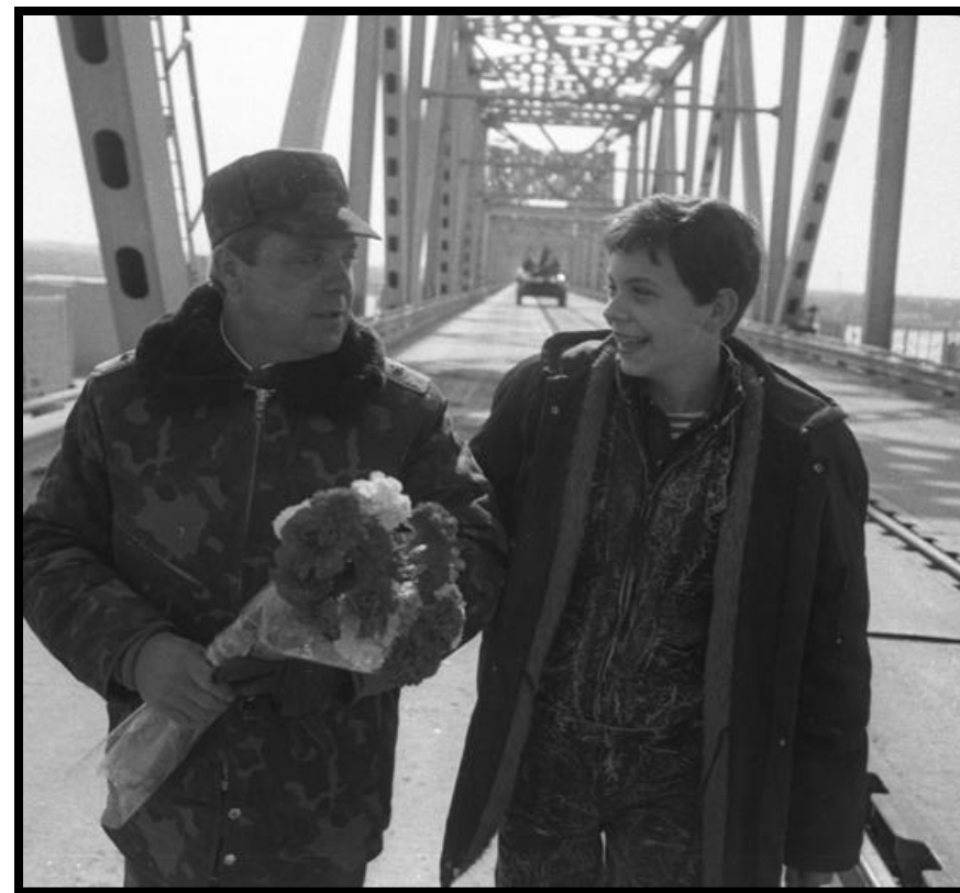
Борис Громов и сын Максим. Последние мгновения афганской войны.