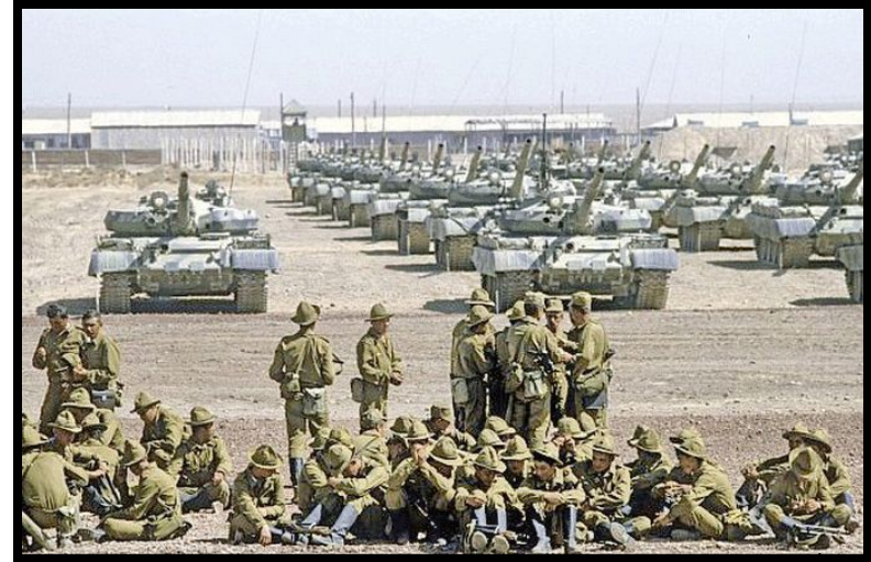
Ввод советских войск в Афганистан