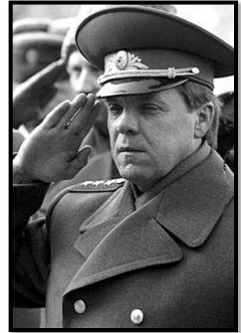
Громов Борис Всеволодович