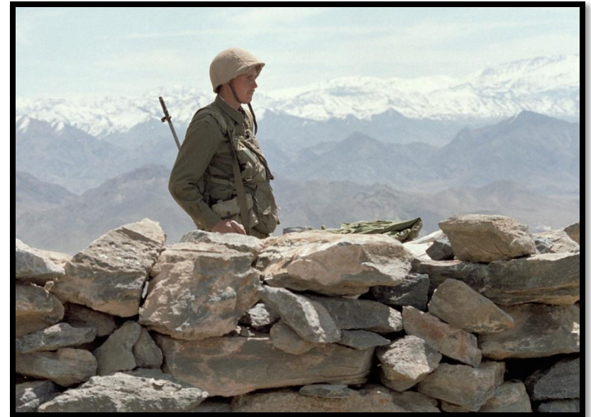
Советский солдат в Афганистане, 1988 год