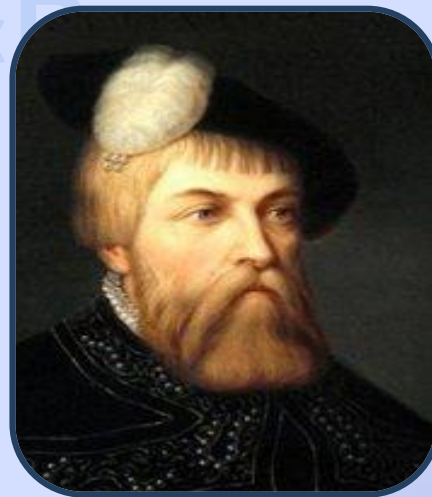
Король Швеции Густав Васа 1

Галеон – первый большой корабль в Шведском флоте