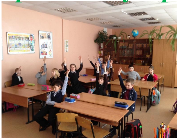
2. Конкурсы и игры