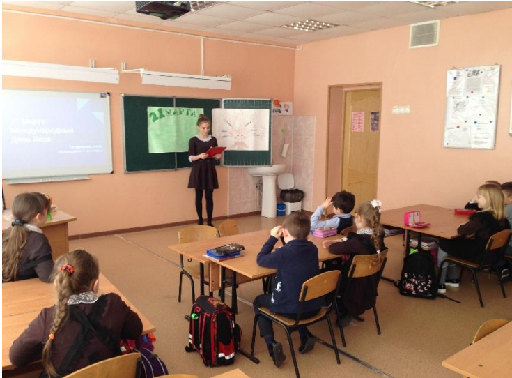
1. Знакомство с праздником «Международный день леса»