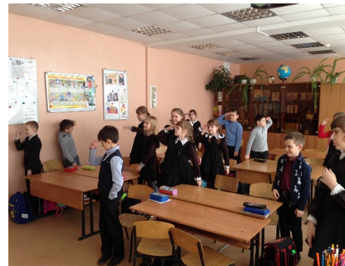
3. Работа в группах и составление итогового плаката