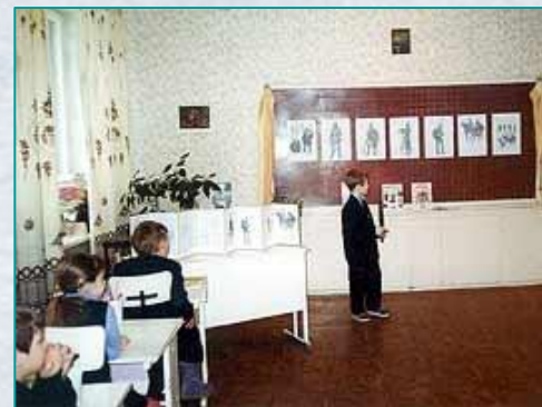
Средняя школа № 5, г. Петрозаводск