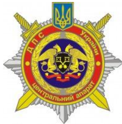
Державна пенітенціарна служба