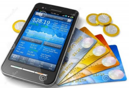
Mobile-банкінг «Ощад 24/7»

Операції з рахунком «Мобільні заощадження»