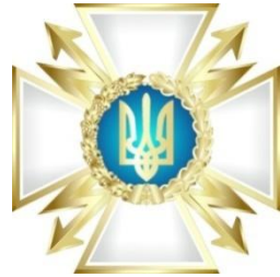
Державна служба спеціального зв'язку та захисту інформації