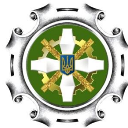
Пенсійний фонд України