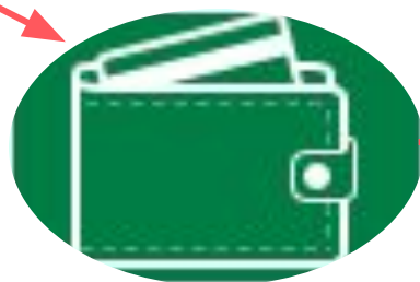
Платежі та перекази