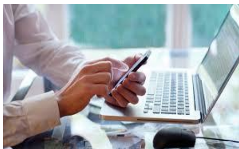
WEB-банкінг «Ощад 24/7»