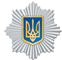
Міністерство внутрішніх справ України