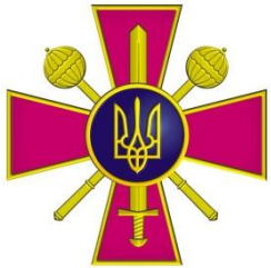
Міністерство оборони України