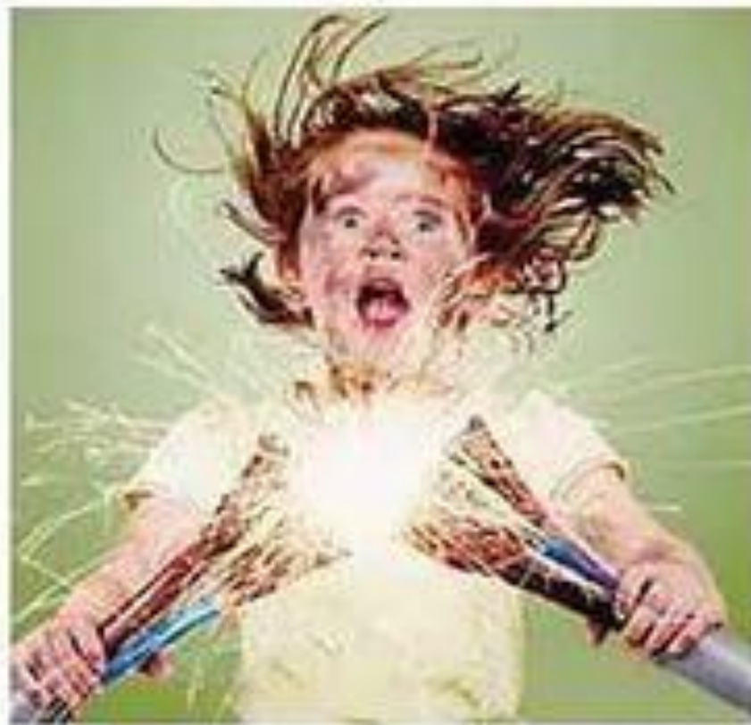
Мал. 189. Можливі наслідки недбалого ставлення до правил безпечного користування електроприладами