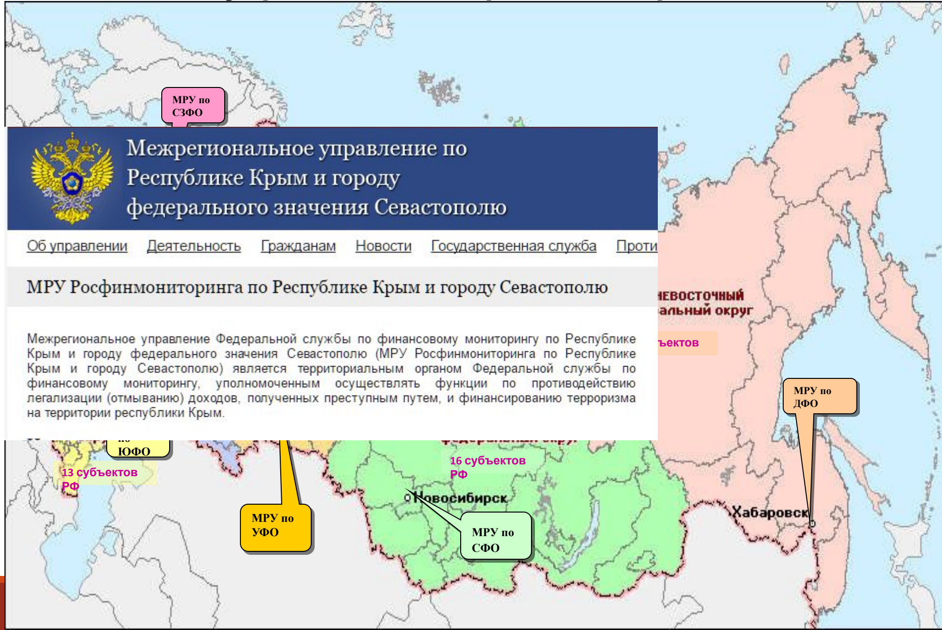
Схема размещения межрегиональных управлений Росфинмониторинга