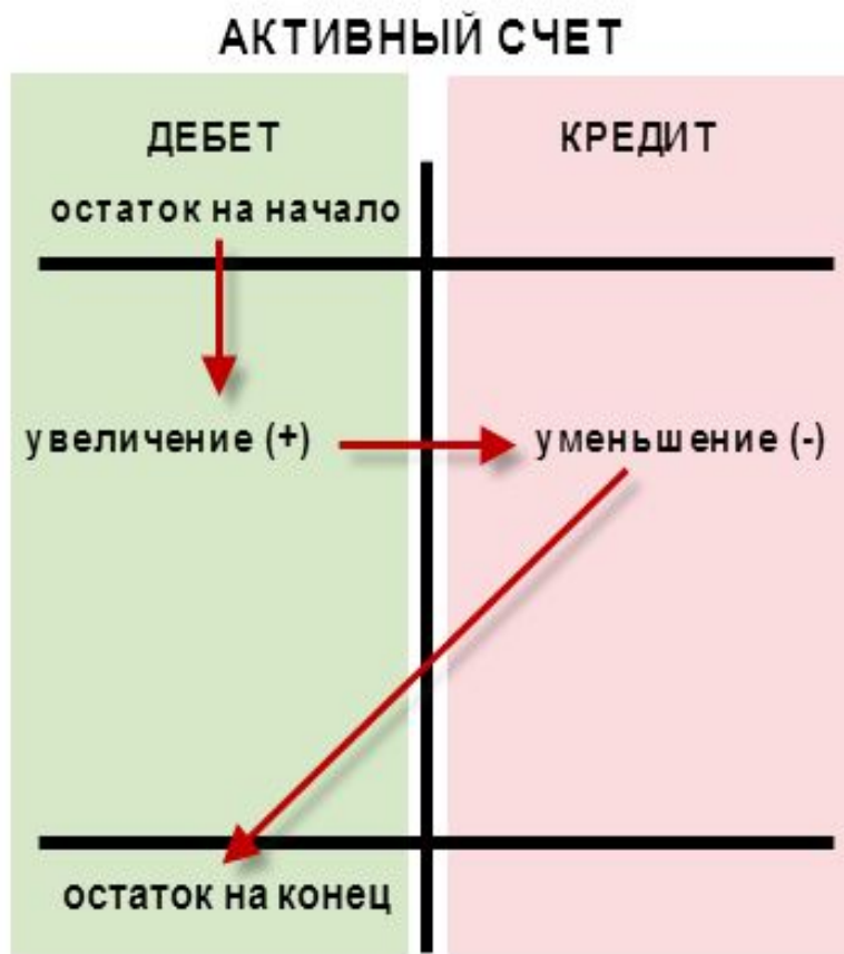
Схема активного и пассивного счетов