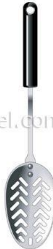
+ cuiller à égoutter