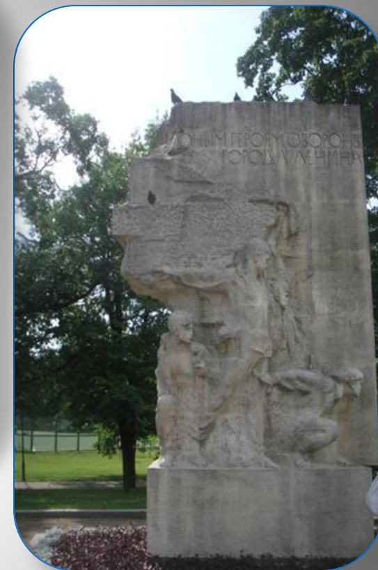
Памятник пионерам-героям, погибшим в Великой Отечественной Войне, Санкт- Петербург, Таврический сад