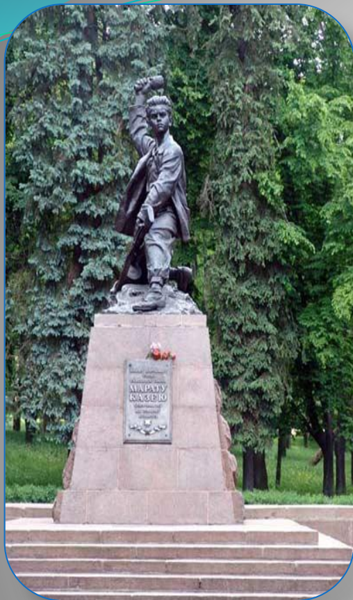
Памятник пионерам-героям, погибшим в Великой Отечественной Войне, Москва, ВДНХ