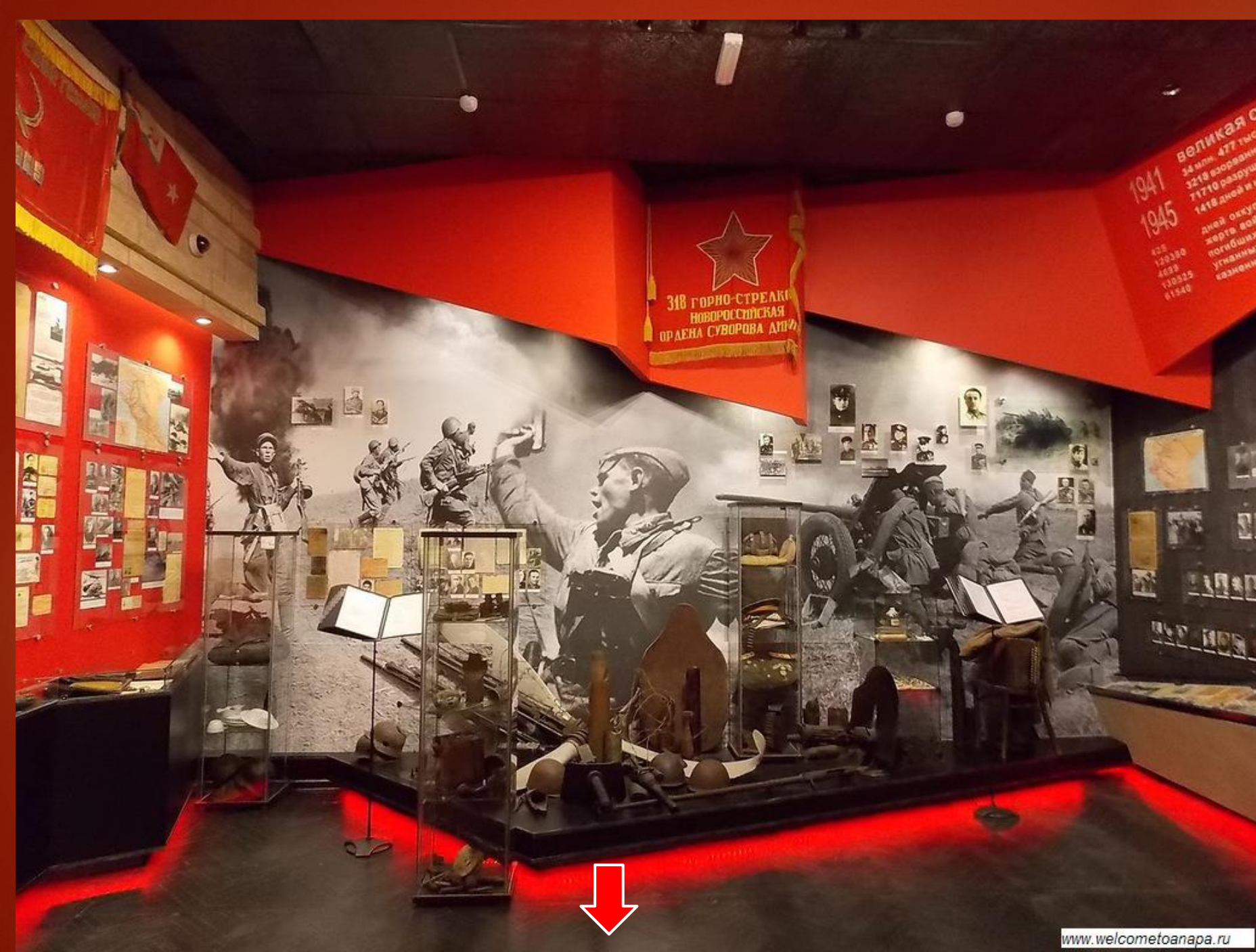
Экспозиция Великой Отечественной Войны 1941-1945 гг.