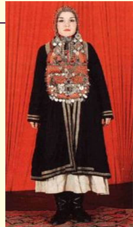
Башкирский женский костюм

Прямоспинного покроя черная верхняя одежда - елян , удлиненный нагрудник- селтэр с бахромой, плотно охватывающая голову коралловый кашмау придавали облику женщины величие и монументальность. В состав праздничной одежды населения долины реки Демы входили примерно те же предметы, что и на юго-востоке Башкортостана: халат елян , головной убор - кашмау , нагрудник - сакал . Своеобразная форма этих вещей придавала демскому костюму иной облик. Суженный в талии елян , мягко закругленный сакал делали костюм этих мест легким и изящным. Исключительную красочность костюму курганских башкир придавали нагрудник с кораллами и звенящими монетами.