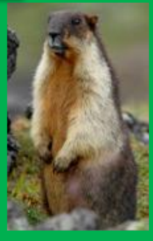
Монгольский суслик - тарбаган