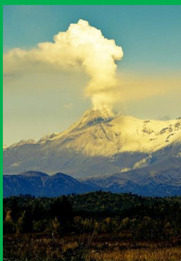
Вулкан Кроноцкая сопка

Кроноцкий заповедник — одна из старейших охраняемых природных зон России. Он расположен на Камчатском полуострове и примыкает к Тихому океану. Именно здесь находится знаменитый действующий вулкан Кроноцкая сопка, множество водопадов, Долина Гейзеров и термальные озёра. Это единственное место на материке Евразия, где есть гейзерные поля. Здесь обитает крупнейшая в России популяция бурых медведей.