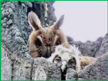
Тетерев Ушастая сова