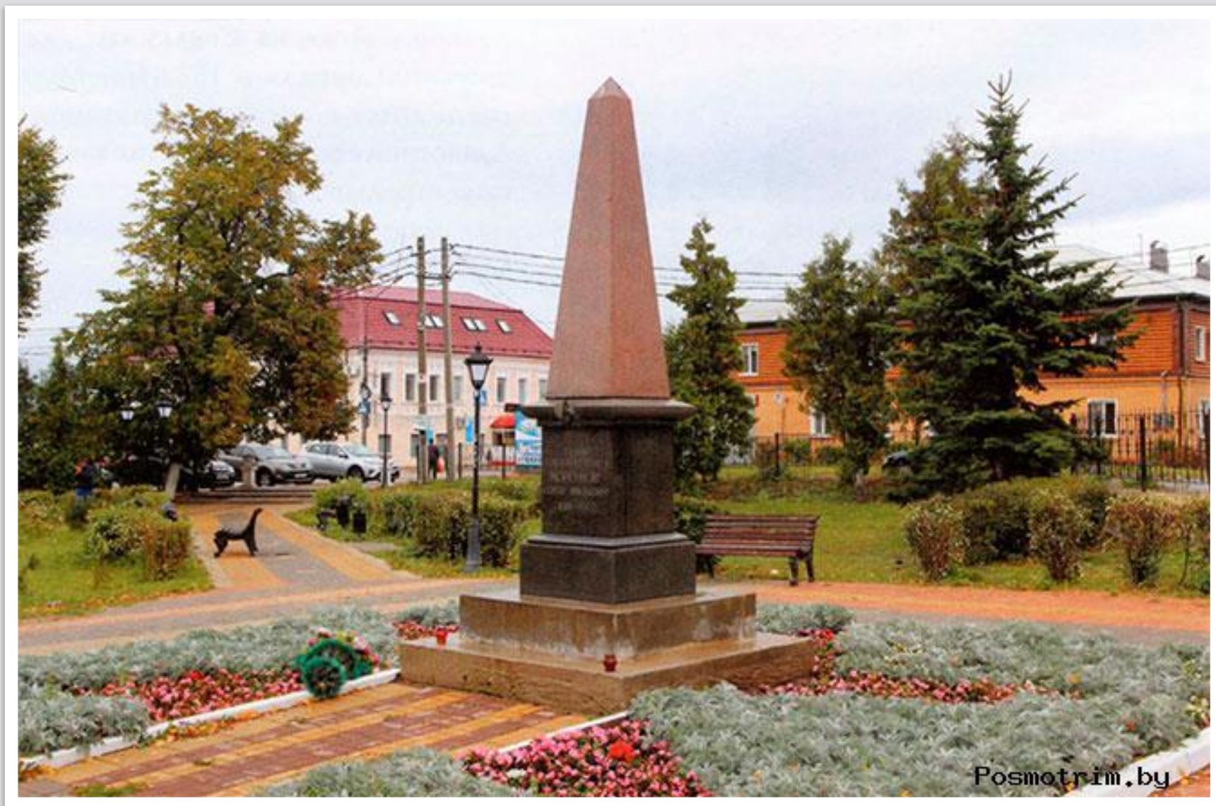
Сквер имени Моргунова