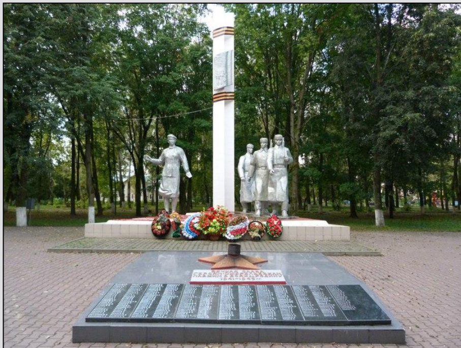
Мемориал в г.Ожерелье Мемориал построен на месте захоронения железнодорожников. Ожерельевцам приходилось составлять, принимать и отправлять воинские эшелоны под систематическими бомбежками и обстрелами фашистами.