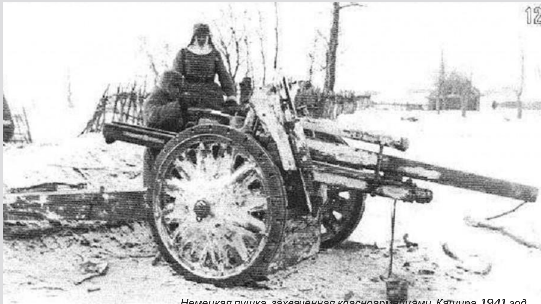
Немецкая пушка, захваченная красноармейцами. Кашира, 1941 год.