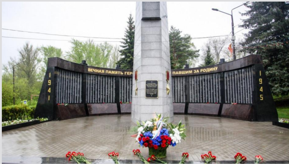
Памятник бессмертия, г.Кашира