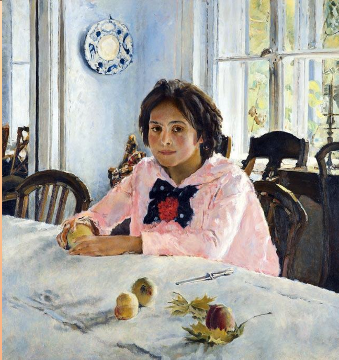
В.А. Серов. Девочка с персиками (портрет дочери С.И. Мамонтова - Веры). 1887 г.