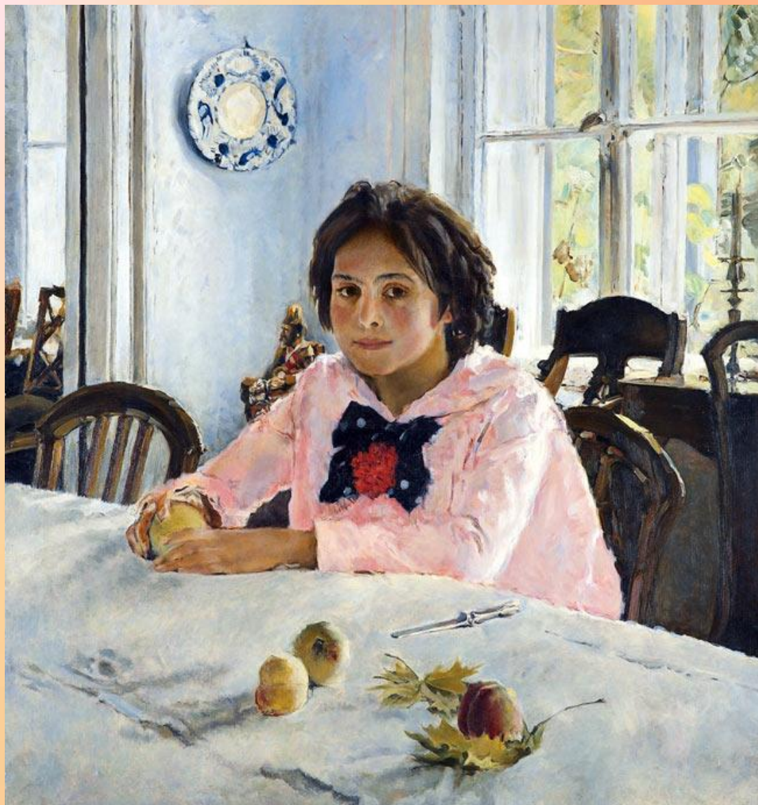
В.А. Серов. Девочка с персиками (портрет дочери С.И. Мамонтова - Веры). 1887 г.

«Каков валёр! » — воскликнул автор картины, когда увидел ее в экспозиции Третьяковской галереи спустя четверть века после ее создания.