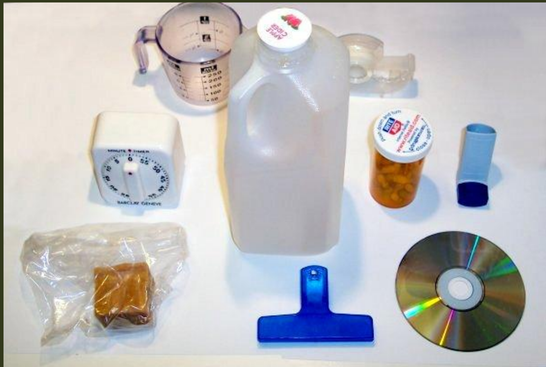
Предмети побуту, повністю або частково виготовлені з пластмаси