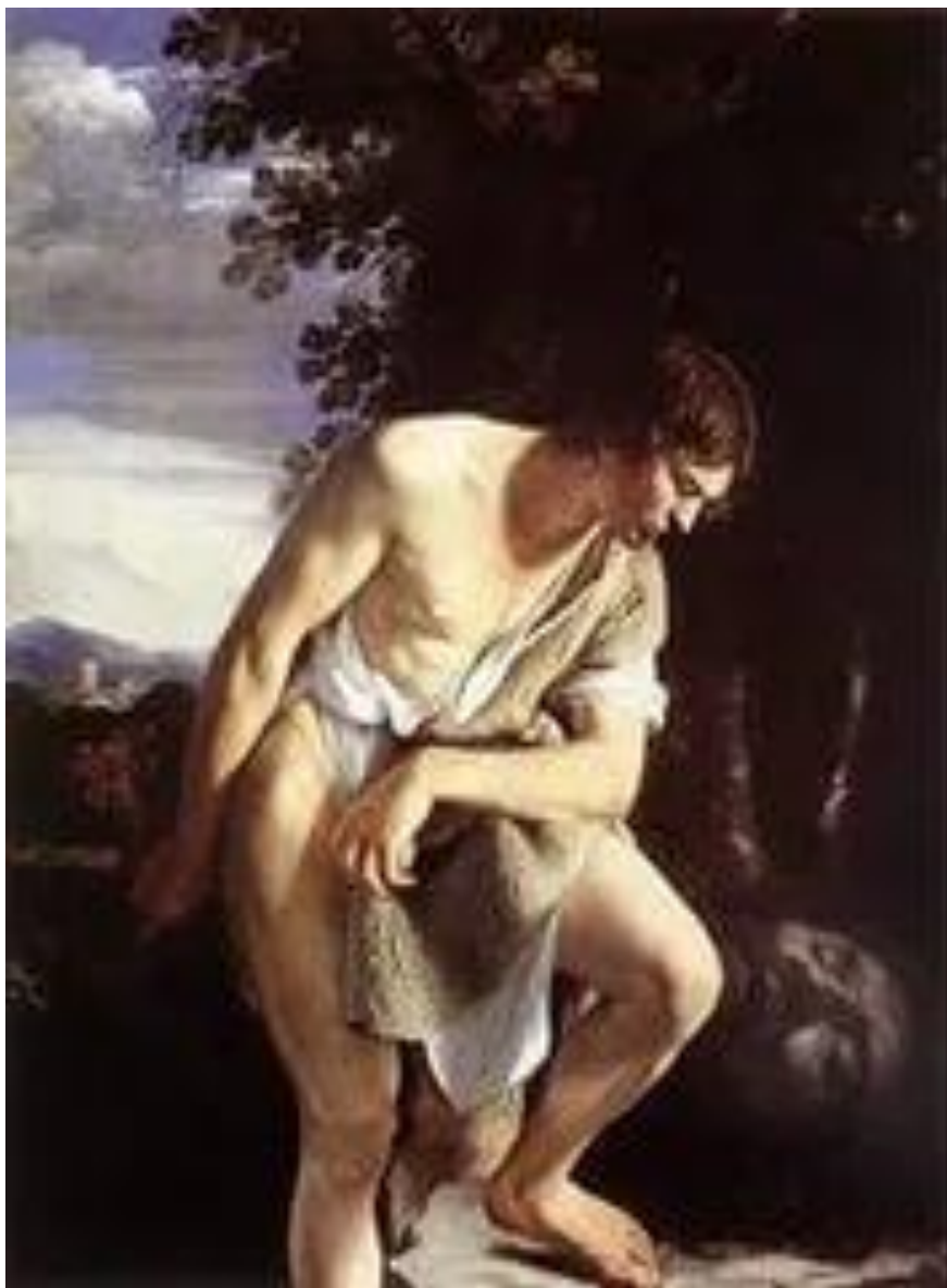
О. Джантилески. Давид с головой Голиафа.