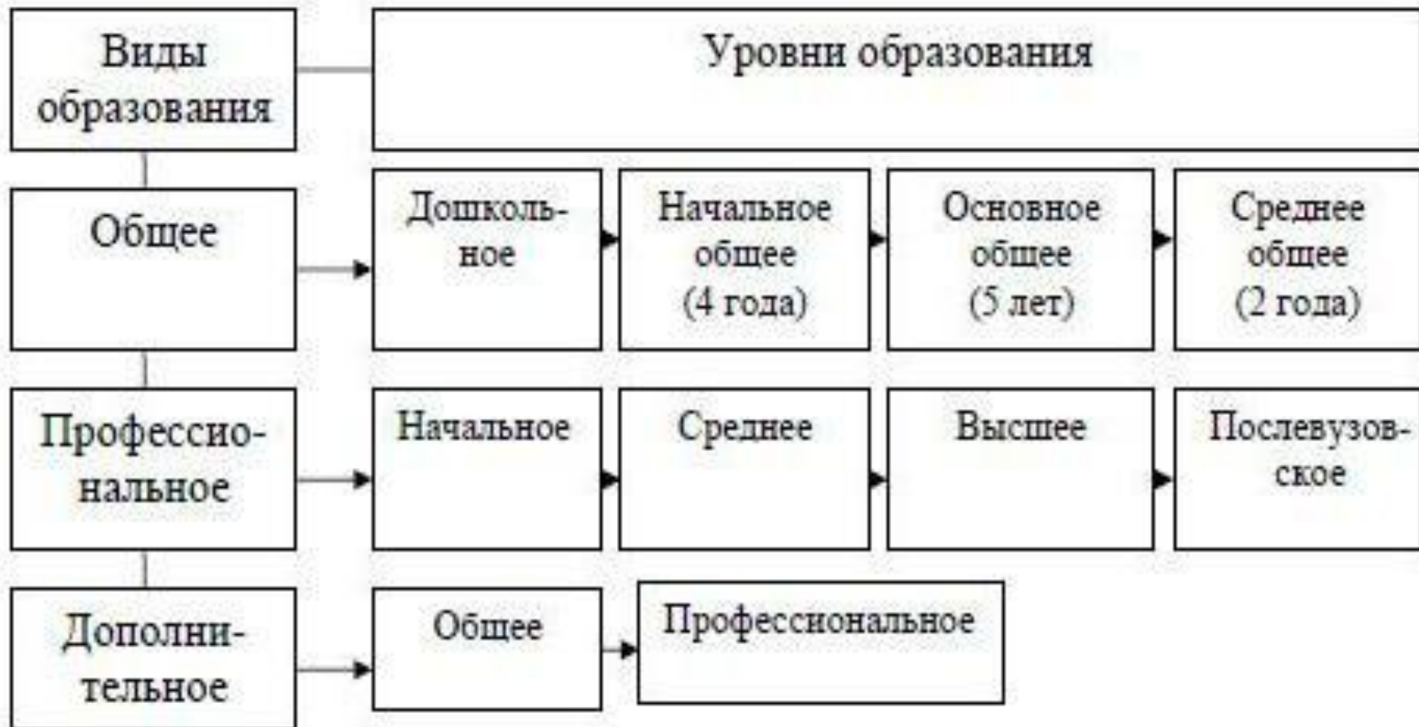
Схема системы образования в России